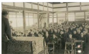
公民館時代の武徳殿での市長就任演説会