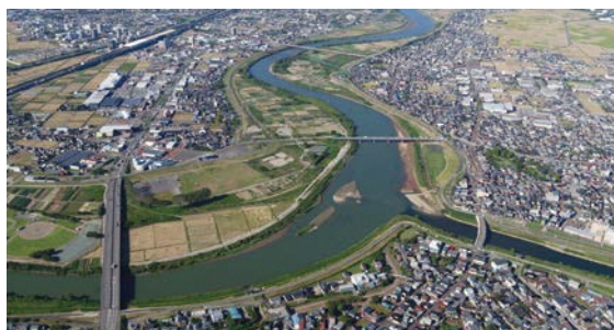
信濃川と五十嵐川との合流点

常設展では、「三条らしさ」というものが、豊かな自然を育んだ「川」と、「ものづくり」の創意にみちた人々の営み、その中での人々のくらしによって、どのように醸成されてきたのかをテーマに、遺跡出土品や江戸時代の古文書、昭和時代の民具などの資料を紹介しています。