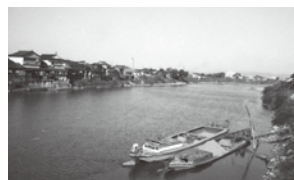
晩秋の五十嵐川(昭和41年)