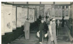
郷土文人遺墨展の様子