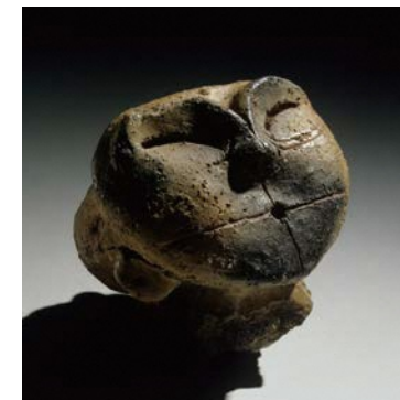
吉野屋遺跡出土土偶