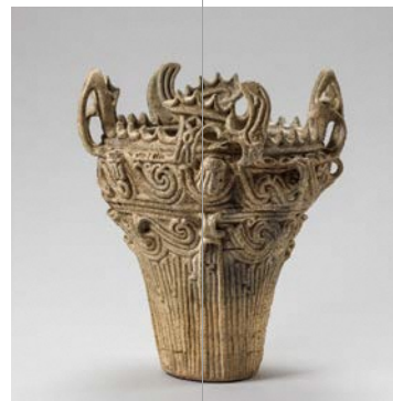
吉野屋遺跡出土火焰型土器

日本遺産『「なんだ、コレは！」信濃川流域の火焰型土器と雪国の文化』の構成文化財である吉野屋遺跡出土の火焰型土器や土偶、新潟県指定有形文化財保内三王山古墳群出土品を展示し当時の人々の暮らしを紹介します。