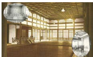
武徳殿竣工記念絵葉書