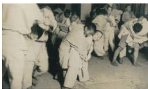
公民館時代の武徳殿での柔道の練習