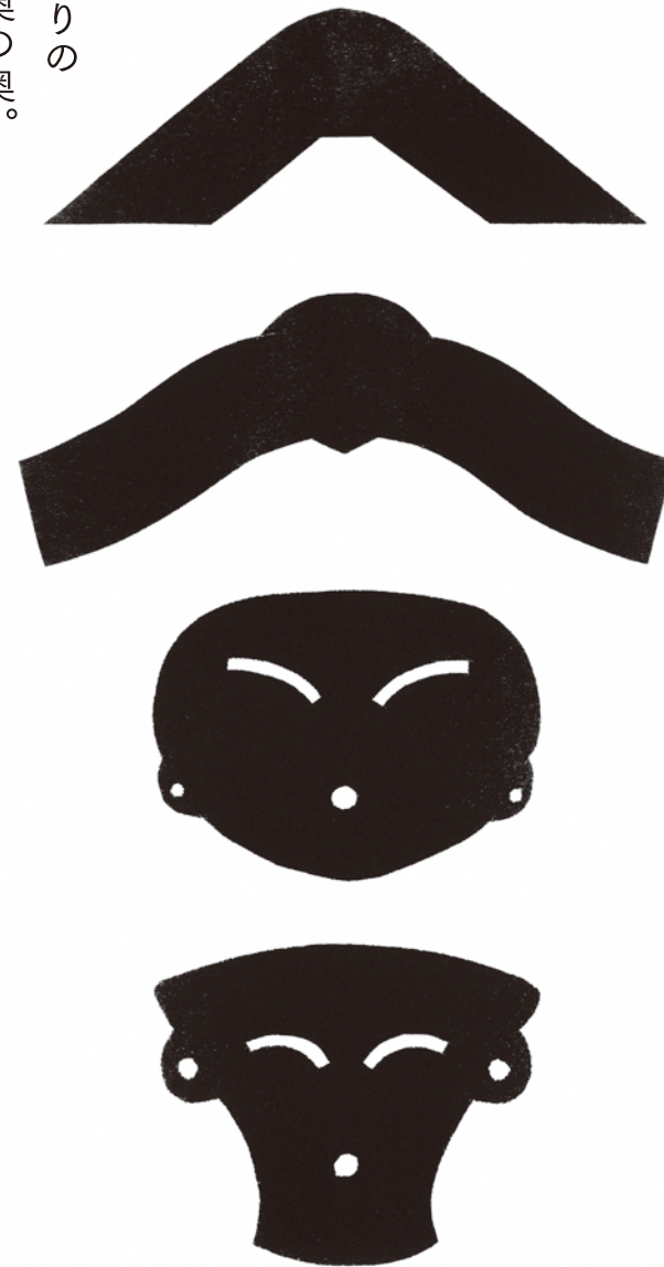
三条市歴史民俗産業資料館

Sanjo City Museum of Historical, Folkloric, and Industrial Materials