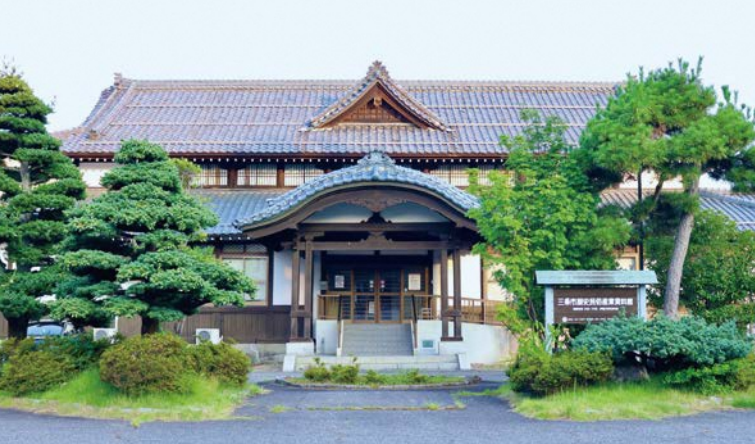
The largest document in the archive