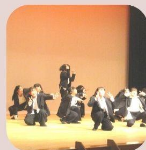
performance 中高生による発表