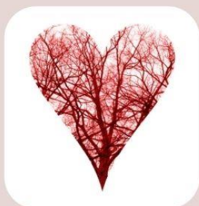
health 血管年齢測定 & 健康アドバイス