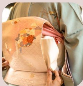
tradition 着物で撮影会 茶席