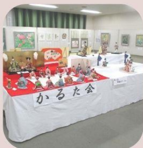
art 中央公民館作品展