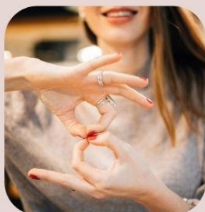
welfare 手話体験 虹のマルシェ