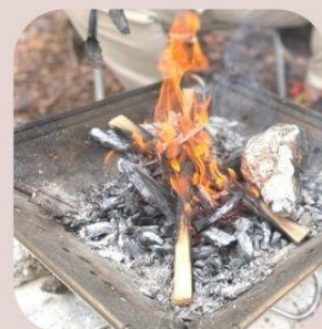
blacksmith 薪割実演と焚火 蹄鉄づくり講座