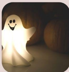
attraction くらやみっしょん!