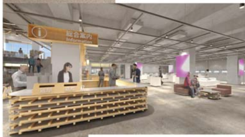
本館 1F 総合案内・鍛冶ミュージアム