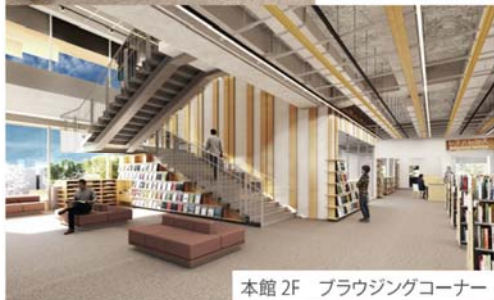
本館 2F ブラウジングコーナー