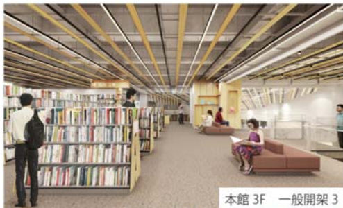
本館 3F 一般開架 3