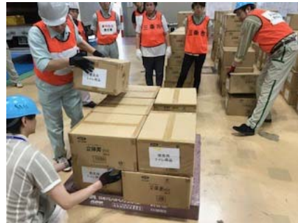
昨年度の物資搬入搬出訓練の様子