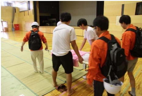
避難所における 中学生ボランティアの活動