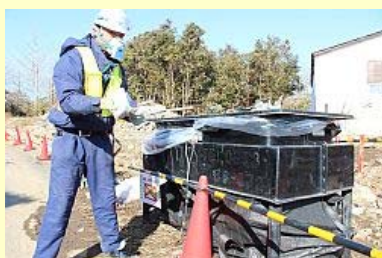
小さなものは手作業で