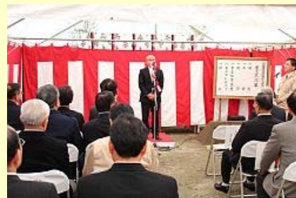
安全祈願祭であいさつする桜井市長

安全祈願祭は、市や県、工事関係者など約30人が出席。この後行われた着工式では、着工宣言に合わせて着工ボタンが押され、重さ約1トンの消波ブロックが設置され、堤防の復旧工事がスタートしました。