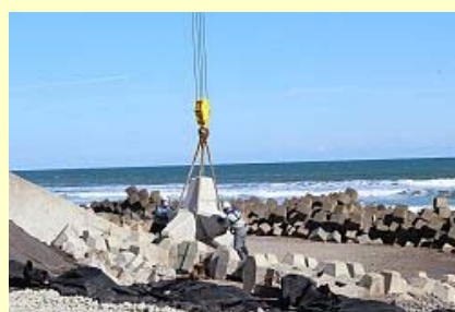
本格化する復旧工事