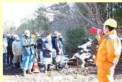
説明を受ける見学者

重機を使うことによって作業員の被ばくを極力防ぎ、作業の効率化と効果的な除染方法を調査・提言するもので、市木質バイオマス発電施設建設等緊急調査事業の一環として行われました。山林の傾斜に応じて「ハーベスタスキッド」など2種類の重機を使い樹木の伐採や集積などを行いました。