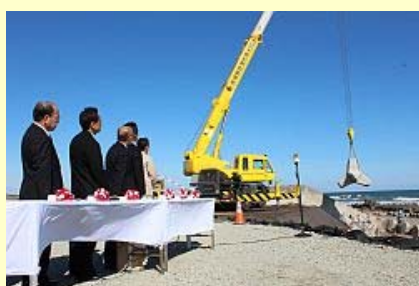
クレーンで運ばれる消波ブロック