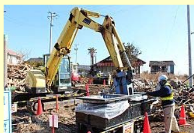
重機を使って効率よく