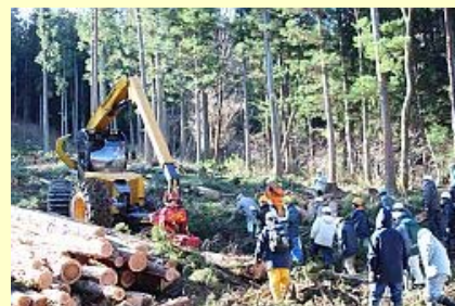
間近で確認する見学者