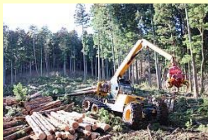
ハーベスタスキッド