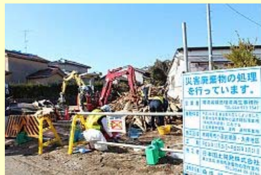
ようやく始まった撤去作業