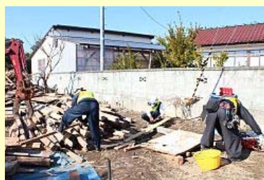
くぎなどを抜き取る作業員