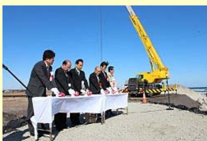
着工ボタンでスタート