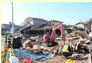
大量の災害がれき