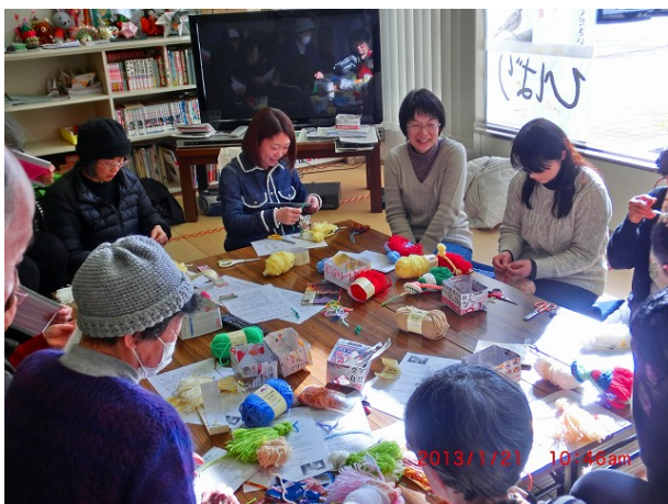
指導していただける方の説明を聞きながらスタート！

午前10時過ぎから午後2時半ぐらいまで、皆さん真剣に取り組んでいました。皆さんの思いは必ず届くと思います。