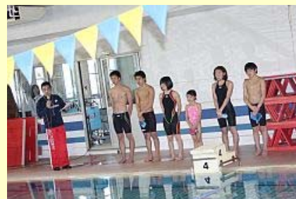
デモンストレーションの選手