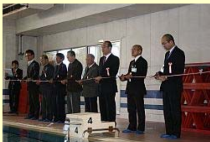
テープカットで再開