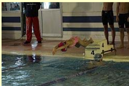
リレーを披露する選手