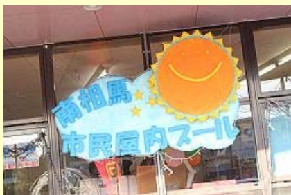
1年10カ月ぶりのプール

プールは市が昨年9月に譲り受け、市内のNPO法人フロンティア南相馬が運営し、高齢者のリハビリなどにも活用するそうです。