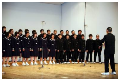
精いっぱい歌声を披露しました