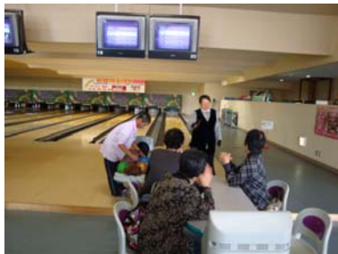
皆さん楽しんでます。