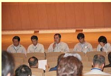
整備計画を説明する職員

住宅は市内で350戸を建設し、鹿島区は2カ所に60戸、原町区は候補地未定の2カ所を含む5カ所に250戸、小高区は2カ所に40戸の整備を計画し、自力で住宅再建が困難な世帯に賃貸を提供します。