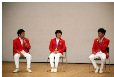
オリンピック出場選手による 貴重なお話が聴けました