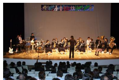
吹奏楽部によるすばらしい演奏