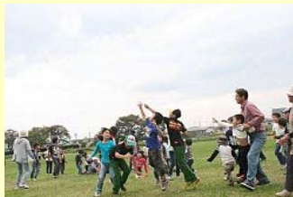
落下傘を取り合う「ちびっこ神旗争奪戦」