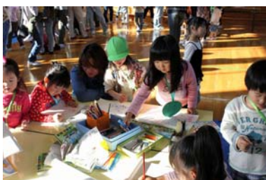
お絵かきコーナー