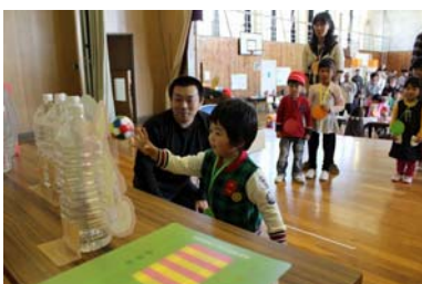
狙いを定めて「エイっ！」

園児たちは保護者と一緒に各コーナーをまわり、夢中になってゲームコーナーで遊んだり、動物コーナーではヒヨコなどの動物と触れ合って楽しいひとときを過ごしました。