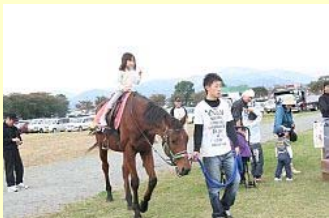
ふれあいを楽しむ子供