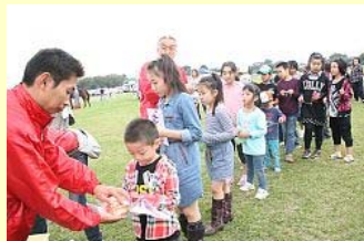
景品を受け取る子供たち