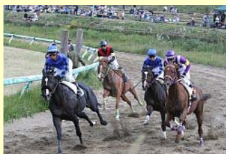
勢いよく駆け抜ける出走馬

宇多郷、北郷、中ノ郷、小高郷、標葉郷から35頭が出走し、1200mのダートコースで予選から決勝まで10レースを繰り広げました。会場に集まった観客は豪快な走りで風を切る人馬に盛んな声援を送っていました。