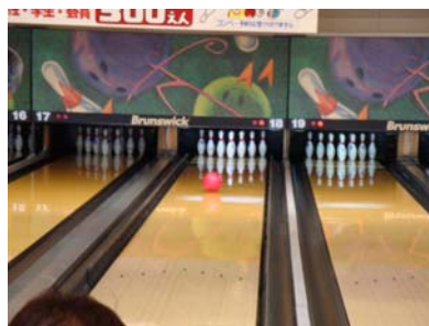
一番ピンに向かっていきます。 結果は、……お見事！！