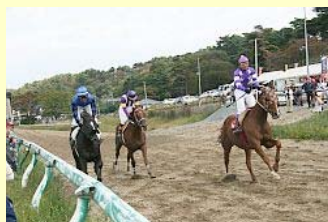
ゴール直前の攻防！