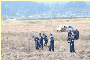
手掛かりを探す警察官