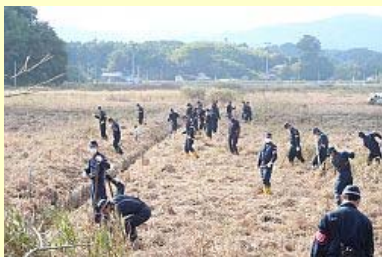
井田川地区を懸命に捜索

このうち小高区の井田川、浦尻の両地区では排水によって捜索が可能になった約200ヘクタールの農地に91人の警察官が大掛かりな捜索を展開しました。