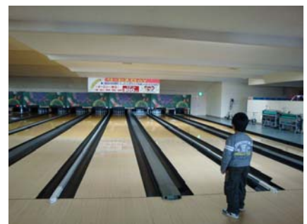
楽しい～！ 2ゲームだけ… もっとボウリングしたいよ～！ （男の子）