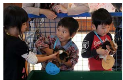
かわいいモルモットと一緒に