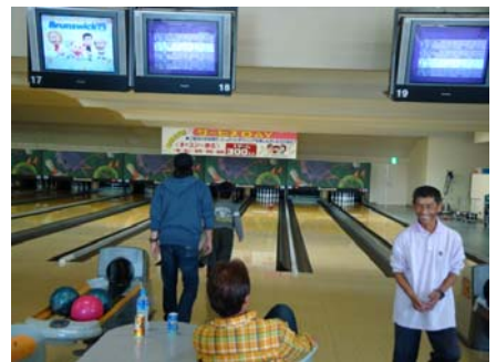
今回が、初めてのボウリング！ やってみたらすごく楽しいと 満面の笑顔でした。