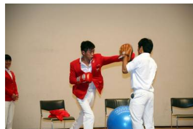
これが世界のパンチ！