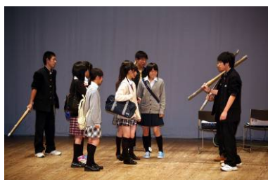
みんなが主役?! 熱演ぶりが伝わってきます