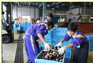
南相馬市クリーンセンター