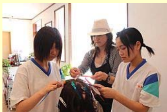
ヘアー ジュピター