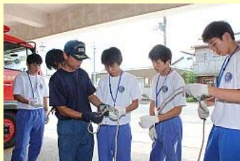
南相馬消防署鹿島分署