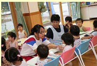
よつば乳児保育園西町園