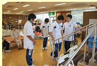
南相馬市立総合病院