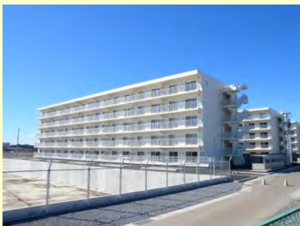
(写真は いわき市 四ツ倉団地)