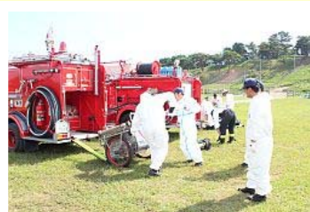
タイベックスーツを着込む参加者

避難区域での大規模な林野火災に備え、参加者は放射性物質から身を守るタイベックスーツを防火服の中に身に着け、遠距離中継放水など15種類の訓練に取り組みました。