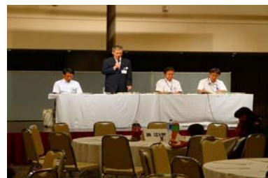
福島県職員等による現状報告の様子