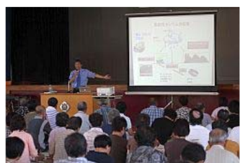
図解で分かりやすく！