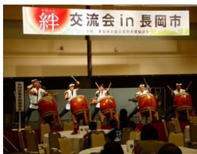
大川溪流太鼓保存会の皆さん