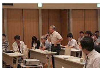
意見を交わす市民