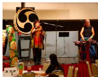
音流楽による太鼓とオカリナの演奏