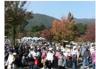
スタート時の様子