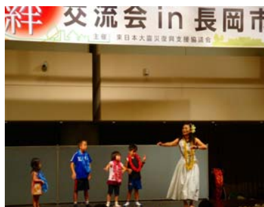
子供達も参加してのフラダンス