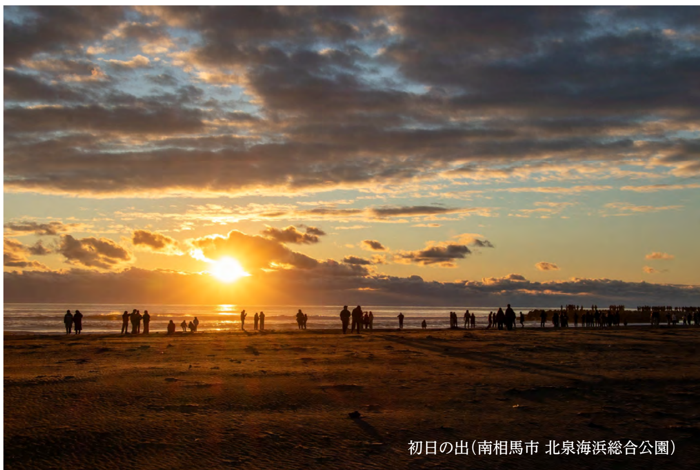
初日の出(南相馬市 北泉海浜総合公園)

皆様の生活する上での不安や疑問を少しでも解消していただくための情報紙として、毎週お届けします。