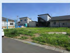
幾世橋住宅団地(全2区画)