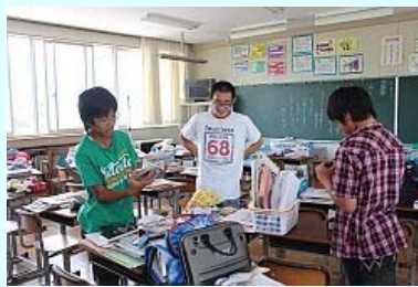
自分の持ち物を懐かしむ