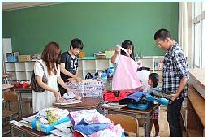
避難先から駆け付け再会