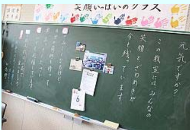
黒板に記されたメッセージ