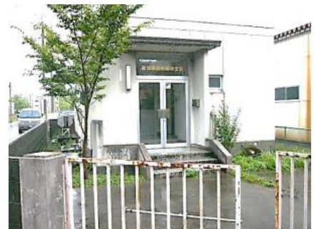
新潟県放射線検査室の外観

※外来駐車場の場所やバス乗り場については、新潟県立がんセンター新潟病院のホームページをご覧ください。