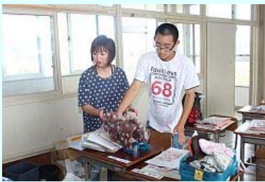
1年5ヵ月ぶりの教室

このうち、小高小では約40人の児童や卒業生が訪れ、校舎内に残っていた教科書などを引き取りました。