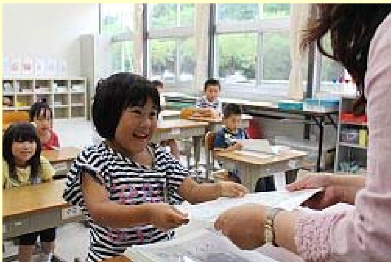
笑顔で受け取る1年生

小高小学校では、鹿島中柔剣道場で式を行い、児童95人が式に臨みました。仮設校舎の教室に戻った児童は、担任の先生から通知表を受け取り、互いに見せ合いながら21日から始まる夏休みに胸を躍らせていました。