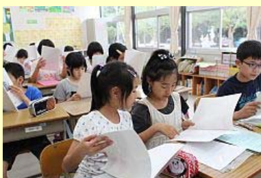
通知表を見せ合う児童