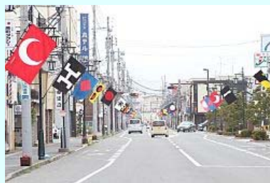
原ノ町駅からの風景