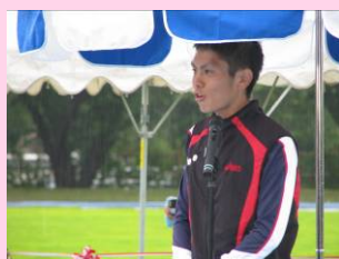
改修披露式へ参加