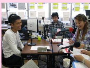
FM番組「おはよう南相馬」に出演