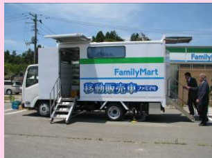
コンビニ移動販売車