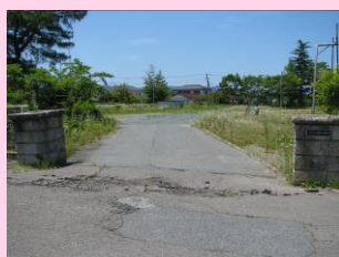
1年間子供の通っていない小高小学校は、3月11日のままで、とても寂しげでした。