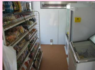
移動販売車の車内