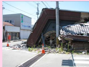
倒壊したままの建物