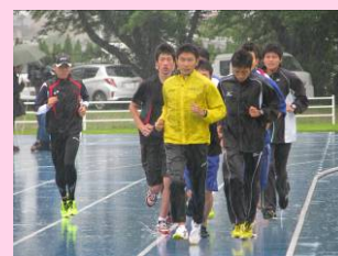
市内の中高生へ指導