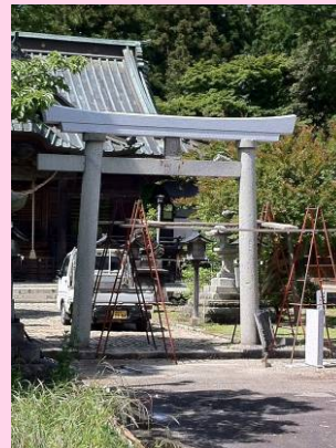
修復作業中の 小高神社の鳥居