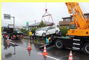
吊り上げられる車両