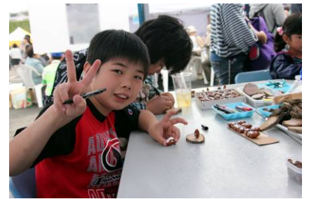
ピース!! どんぶり使った人形作り