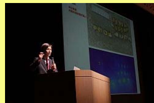
スライドで分かりやすい講演