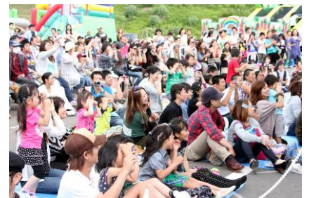
ET-KINGの熱唱に聞き入る観客たち