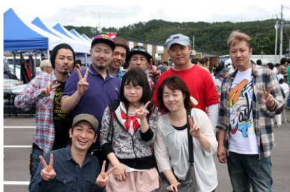
開演前のET-KINGとの記念撮影