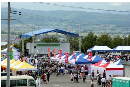
「おおくまふるさとまつり」の会場 松長近隣公園応急仮設住宅駐車場