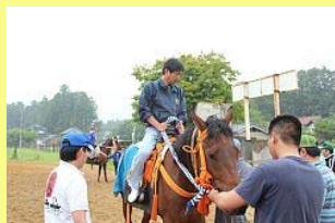
指導を受ける参加者

主に野馬追に初めて参加する人たちのために開催され、順番に馬にまたがって馬場をゆっくりと回り、乗馬の感覚を確認しました。