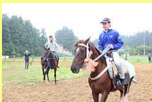
手綱を握りしめる参加者