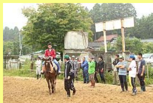
騎馬会関係者が見守ります