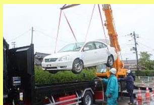
トラックに載せられる車両