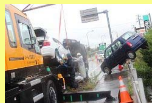
区域内には約200台が残る