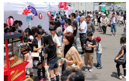
出店もいっぱい! どれにしようかな、