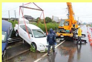
準備が終わり撤去開始