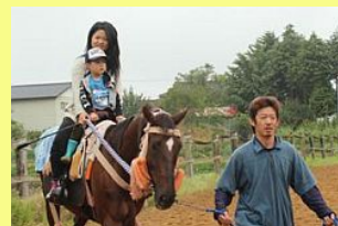
未来の若武者の姿も