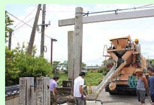
基礎部分に流し込まれる コンクリート