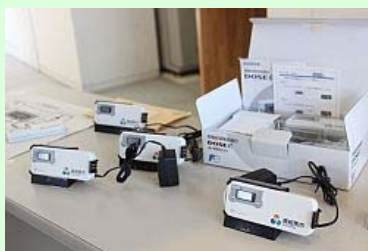
配布される放射線量測定器