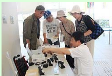
操作説明を受ける皆さん