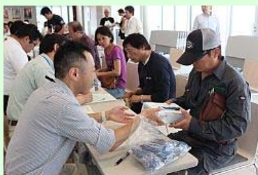
測定器を受け取る市民

配布された線量計は、1時間当たりの空間線量と累積線量が測定でき、市外の避難者を含め2万2940世帯に配布します。