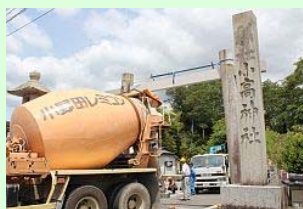
参道入り口の「一の鳥居」