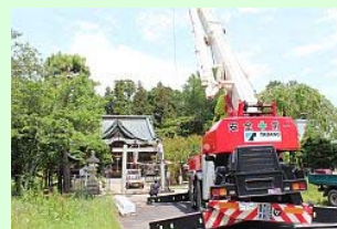
鳥居の前には大型クレーン