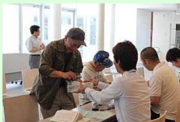
測定器を手渡す職員