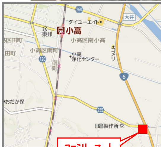
ファミリーマート