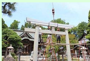
慎重に進められる作業