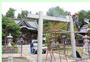
支柱を固定する穴あけ作業

また、参道入り口に立つ最も大きい「一の鳥居」には柱の基礎部分にコンクリートが流し込まれ、三の鳥居と同様に笠木が取り付けられます。