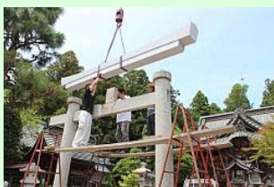
吊り上げられる笠木