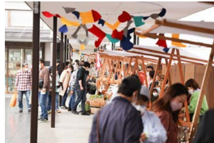
第4回 小高つながる市 出展写真