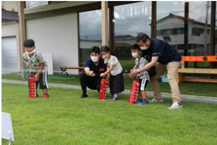
子どもたちと水消火器体験!