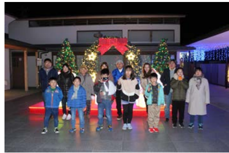
小高交流センターでの一枚！