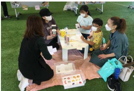
デザインを考えるワークショップ