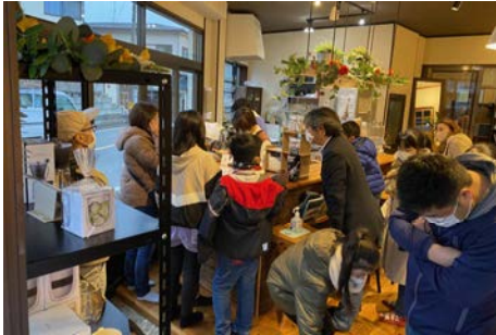
小高のまち歩き（オムスビ）

市内の小学生のいるご家族を対象に、小高のイルミネーションツアーを実施しました。夜は、「故郷喫茶カミツレ」さんに協力をいただき、ご家族みんなでディナーを楽しみました。