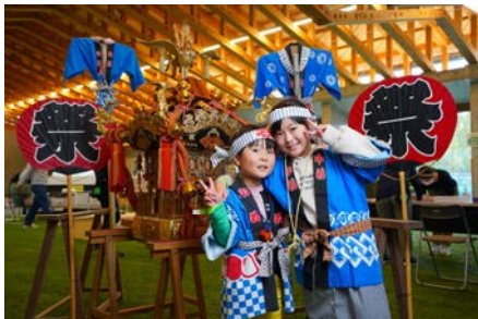
お神輿と一緒に、はいチーズ！