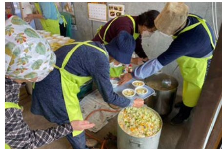
小高マルシェで豚汁のふるまい