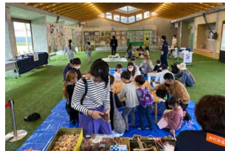
小高の素材で木片工作体験