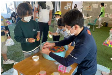
スーパーボールすくい