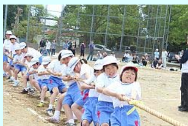
紅白対抗綱引き「よいしょ！」

「みんなの絆をバトンにかえて」のスローガンの下、約100人の児童は徒競走や玉入れなどに取組み、児童と保護者の歓声が響きました。