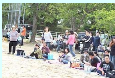
保護者の盛んな声援