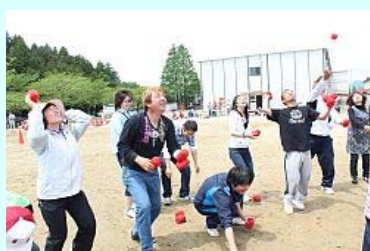
盛り上がったPTA紅白対抗玉入れ