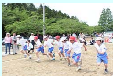
元気よくスタート