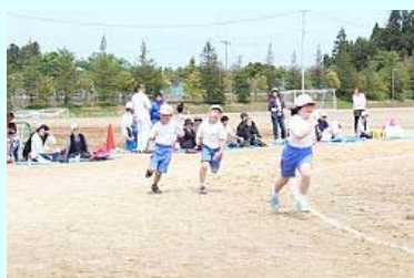
もうすぐゴール、頑張っ