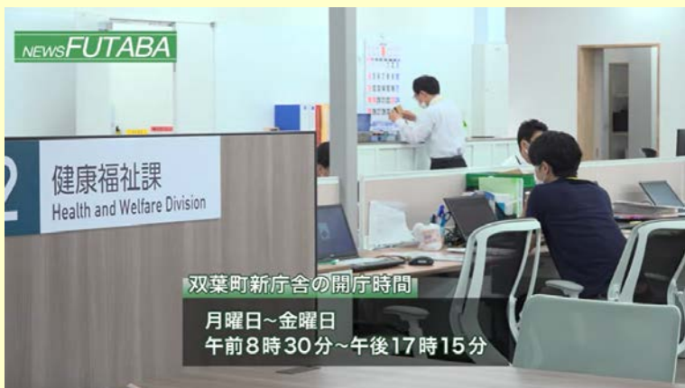
双葉町新庁舎の開庁時間 月曜日～金曜日 午前8時30分～午後17時15分