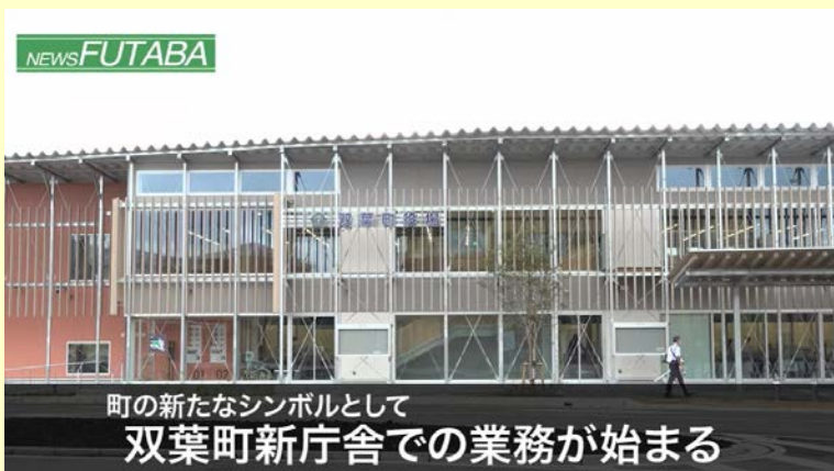
町の新たなシンボルとして 双葉町新庁舎での業務が始まる