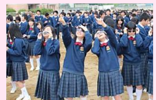
太陽を指差し歓声をあげる