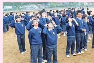
天体ショーに見入る生徒

【5月21日】原町区の石神中学校では、「金環日食観測会」を開き、全校生徒197人が参加しました。登校時間を1時間ほど早め、生徒一人ひとりに日食を観測する専用のグラスが配布され、午前7時40分ごろに太陽と月が重なり光の輪ができると歓声が上がりました。