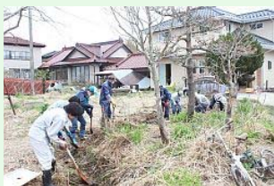
泥で埋まった水路を復旧