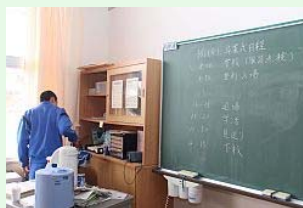
卒業式の日程が残る黒板

校舎の時計は震災が発生した午後2時46分で止まったまま、教室には震災当日に行われた卒業式の日程が書かれた黒板などがそのまま残されていました。