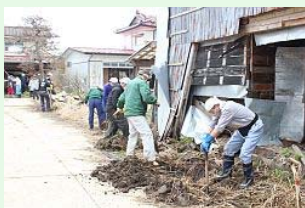
泥をかき出す皆さん