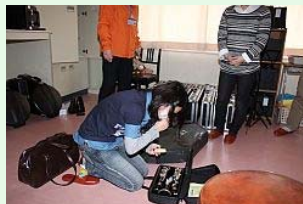
1年振りに楽器と対面し思わず涙