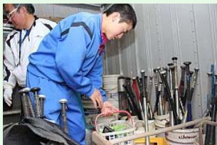
部室の様子も確認