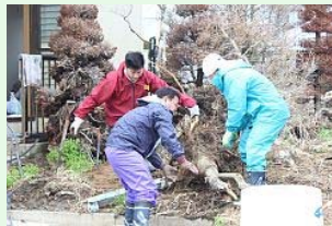
力を合わせて木の根を運び出す

【5月4日】警戒区域が解除された小高区では、ゴールデンウィークの休みを利用して全国から災害ボランティアが訪れ、被災家屋の後片付けやがれき撤去などに汗を流していました。