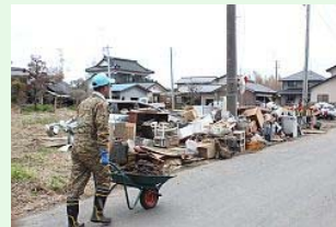
道路わきには大量の...