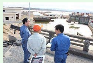
1年前と変わらない状況を見詰める