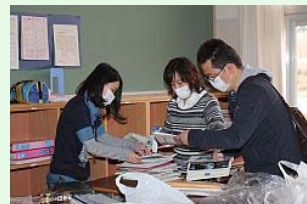
教科書などを整理