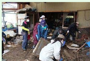
納屋の中にも大量の泥