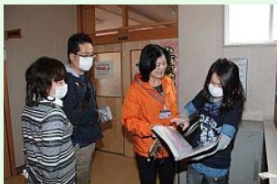
先生と1年前を振り返る