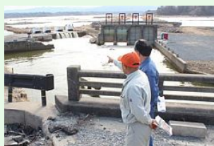
状況を説明する桜井市長