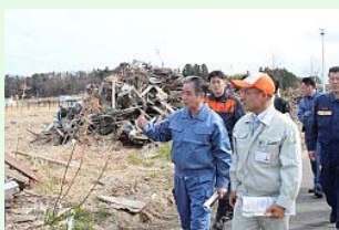
敷地にあるガレキの状況を確認