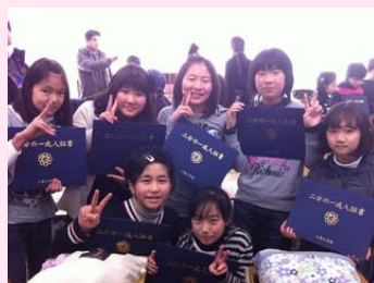
「2分の1成人証書」が子どもたちに (4年生)