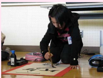
この1年間感じたことを漢字一文字に (6年生)