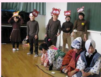
子どもたち、とても楽しそう

子どもたちに感想を聞いたところ、「半分だけれど大人の仲間入りをしたようで嬉しい。大人になってからのことはわからないけれども、5年生になったら避難している友達と再会したい」と話してくれました。