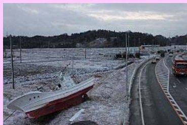
国道6号と漁船(鹿島区小島田)