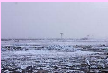
雪に覆われる津波被災地