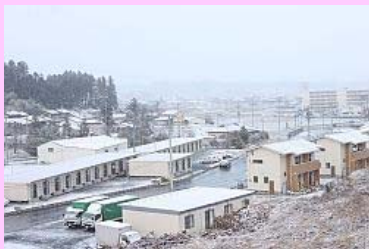
今シーズン一番の寒さ

【12月16日】県内は冬型の気圧配置の影響で冷え込み、各地で平年を5度前後下回りました。南相馬市内では今年初の本格的な雪が午前中から断続的に降り、仮設住宅や津波の被害を受けた住宅跡などを白い雪がうっすらと覆いました。