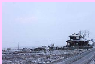
被災住居の屋根にも