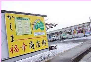
仮設店舗にもうっすらと