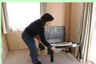
電気こたつを確認