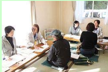
説明を受ける入居者