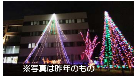
※写真は昨年のもので

【日時】平成23年12月1日 【場所】社団法人 県央研究所 新潟県燕市小高6014 【参加費】無料 【当日スケジュール】