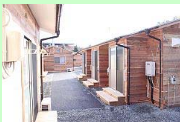
立ち並ぶ応急仮設住宅