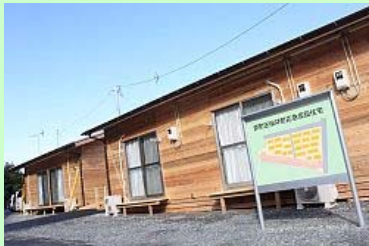
市スポーツセンター西側に建設

原町区に完成した143戸のうち、46戸が建てられた桜井町応急仮設住宅で鍵の引き渡しが行われ、手続きを終えた入居者は早速住宅の扉を開け、新居となる室内を見渡していました。