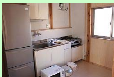
冷蔵庫などの家電セット