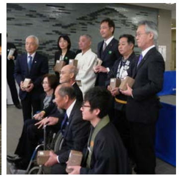
(昨年の追悼式典の様子)