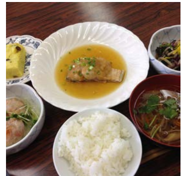
11月食事会のメニューです

申込締切 1月13日(金)正午 交流ルーム「ひばり」 TEL 0256-33-8650