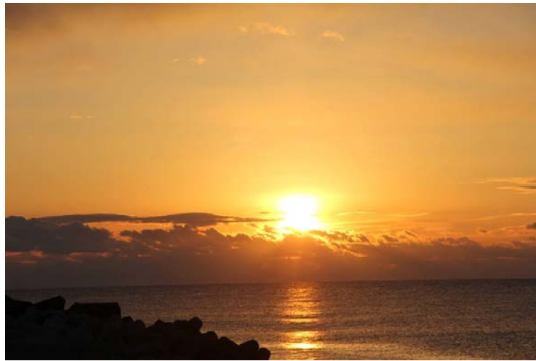
雲海から立ち昇る初日の出(請戸漁港)

浪江町役場から、新年のごあいさつを申し上げます。 本年もまた、復興への道のりを日々心を新たにしていっしょに進んでまいります。