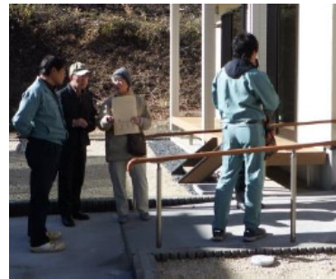
鍵引渡し式後の内覧会