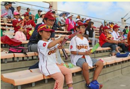
たくさんの家族連れが 声援を送っていました