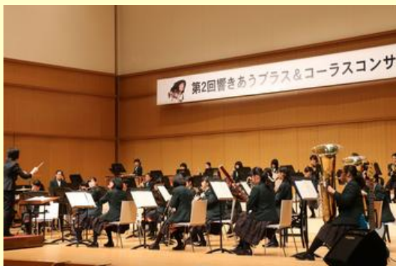
美しい音色が会場を包み込んでいました

また、FCT郡山少年少女合唱団と東京佼成ウィンドオーケストラがゲストとして出演し、美しい音色を響かせました。