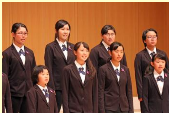
透き通った歌声が響きました