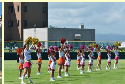
地元のチアガールが 一緒に応援しました