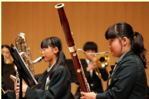
心を込めて演奏する生徒