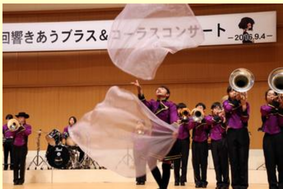
曲目は「津軽海峡冬景色」