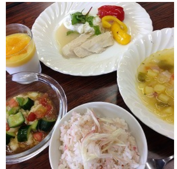
7月の食事会メニュー

申込締切 9月26日(月)正午 交流ルーム「ひばり」 TEL 0256-33-8650