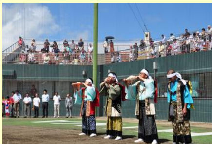
北郷騎馬会が 慰霊の螺を鳴らしました