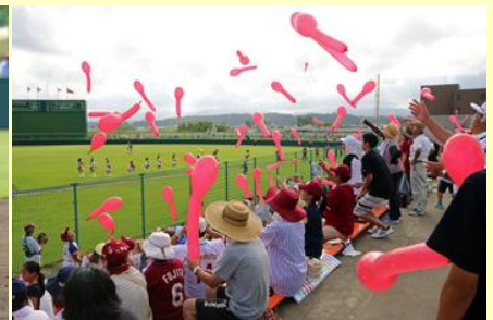
7回の楽天攻撃時のジェット風船