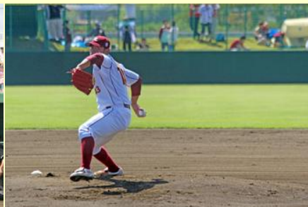
会場には力強い投球音が 響いていました