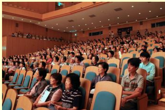
来場者は演奏に聴き入っていました