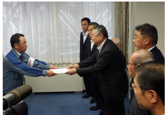
9月1日に県庁で行われた締結式の様子

この協定をはじめ、今後も住民の皆さまの安心安全に寄与できるような取り組みを進め、県と周辺市町村が一丸となって、今後の福島第一原発の廃炉に向き合ってまいります。