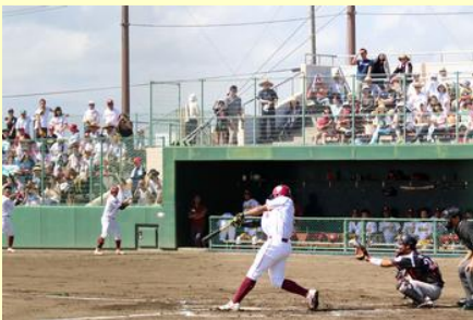
本塁打も飛び出す 迫力満点の試合でした

試合結果は千葉ロッテの勝利となりましたが、試合の前後には東北楽天の選手との触れ合いイベントが催され、子どもから大人まで楽しんでいる様子でした。