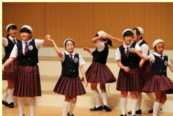
振り付きで楽しく歌いました