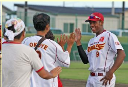
人気選手とのハイタッチ交流