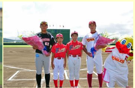
地元の野球スポ少の代表が 花束を贈りました