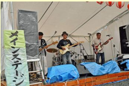
ステージではご機嫌なサーフロックの演奏