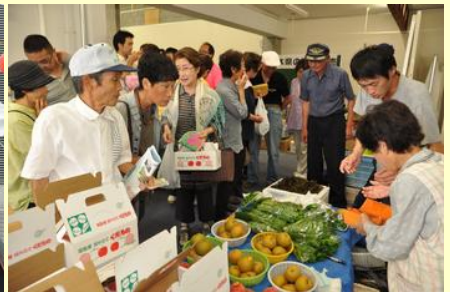
農家の直売は大人気でした