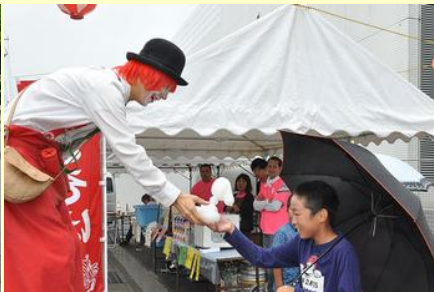
大道芸人から子供にプレゼントのサプライズ