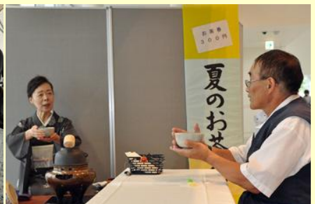
茶席の簡単な流れを学べる体験コーナー