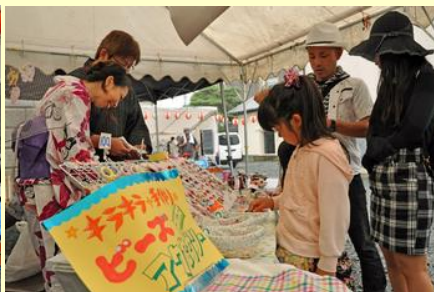
買い物もお祭りの楽しみの一つ