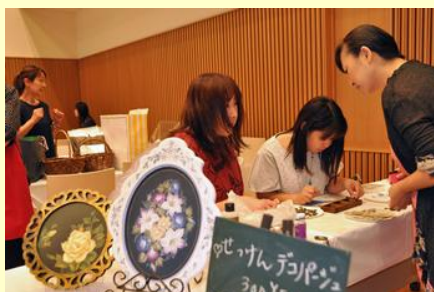
さまざまな趣味を体験できるカルチャースクール