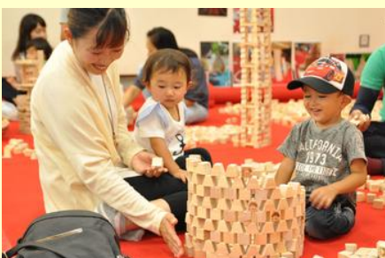
玩具で遊べるコーナーは子どもに大人気