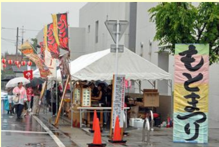
たこ焼きやクレープ、焼き鳥の露店が並びました

銘醸館とゆめはっとの間の道路は歩行者天国となり、出店が並びました。銘醸館では、市内の生徒による縁日など、ゆめはっとではカルチャースクールなどが催され、大人から子どもまで楽しんでいました。