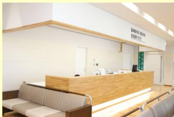
脳卒中センター内の様子