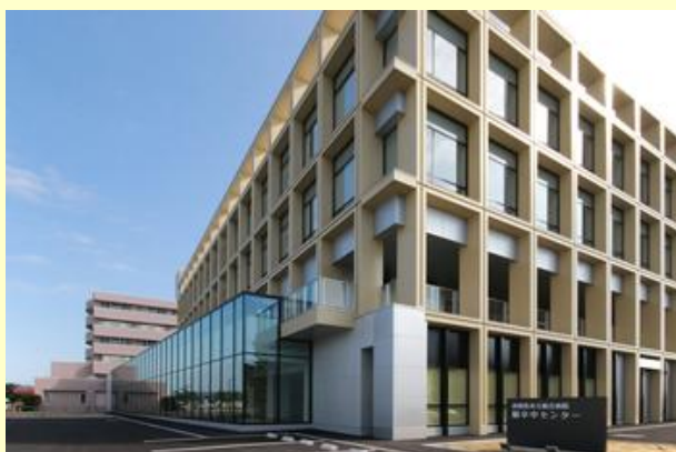
場所は市立病院南です