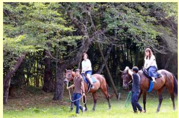
馬に乗り神社の境内を散策する来場者