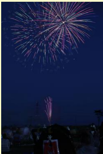
LIGHT UP NIPPONの花火も上がりました