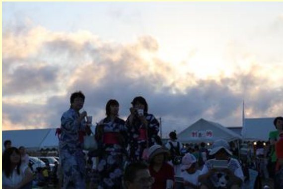
夕暮れを迎え、打ち上げ開始を待つ来場者

催しは、地元のボランティア団体「復興浜団」や原町商工会議所青年部などが震災翌年から始め、今年で4回目です。会場には、有名アーティストのライブステージや露店が並び、多くの家族連れらが楽しんでいました。