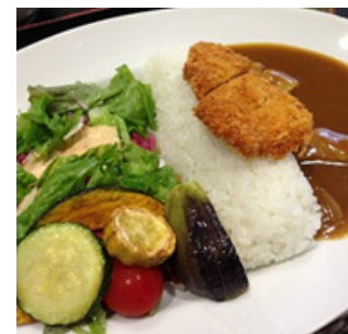
昼食はダムカレー