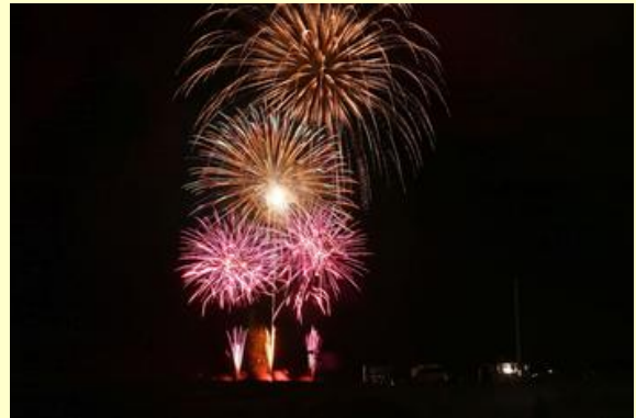
色とりどりの花火が打ち上がりました