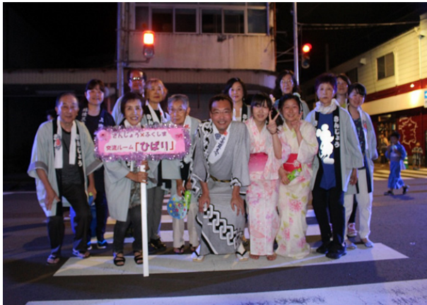
國定三条市長と記念撮影

若い方にも賛同いただき、三条市民のボランティア、民謡連盟の皆さんの協力もいただき、練習の成果を大いに発揮しました。