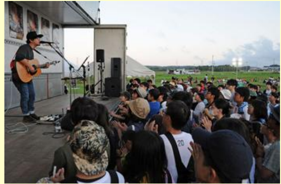
追悼復興ライブで盛り上がる会場