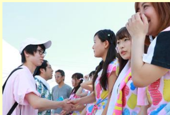
アイドルとの握手会も開かれました