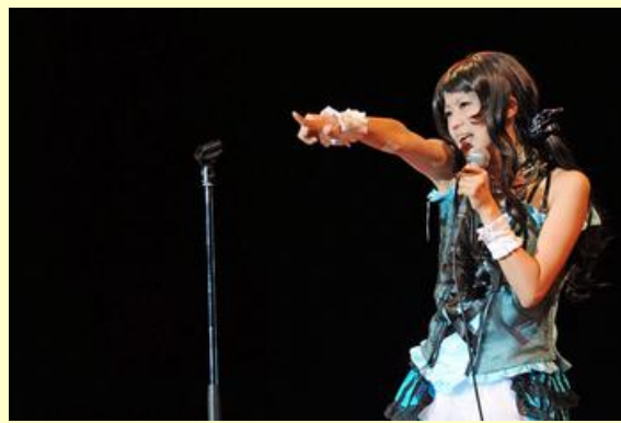
アニメソングを熱唱するのど自慢の出演者