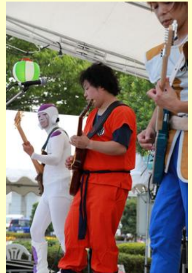
アニメのコスプレで 演奏する地元バンド