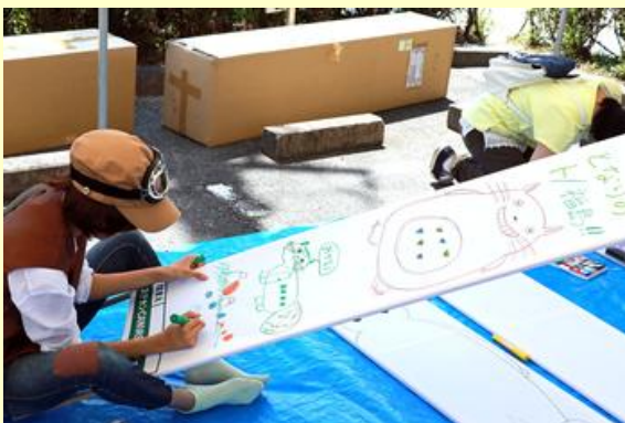
廃看板に絵を描くコーナーもありました