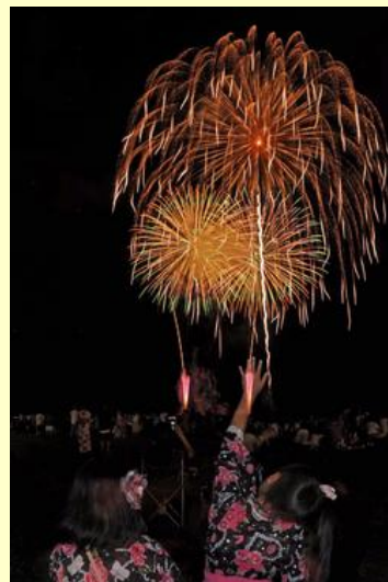
たくさんの子どもたちが見入っていました