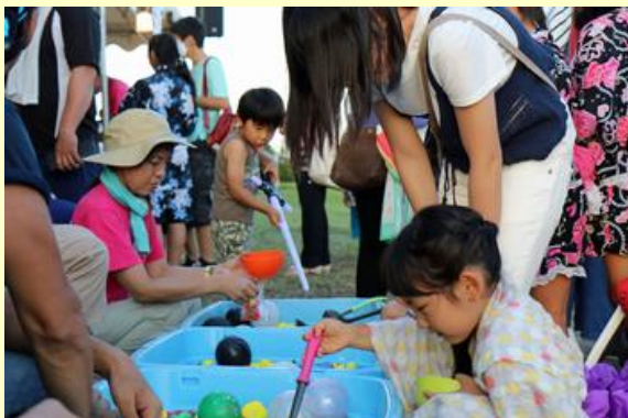
露店で風船すくいを楽しむ家族