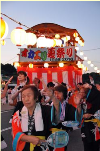
さまざまな人が 同じ踊りの輪を広げました

日没に合わせて、「納涼&コスプレ盆踊り」が始まり、浴衣姿の市民やアニメキャラクターなどの衣装を着た参加者が踊りの輪を広げていました。