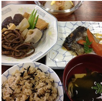
5月の食事会メニュー 「三条祭りのごちそう」

申込締切 7月15日(金)正午 交流ルーム「ひばり」 TEL 0256-33-8650