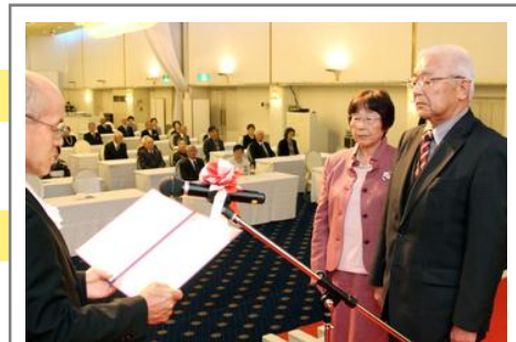
昨年の金婚祝賀会

市内に住所を有するご夫婦で、 (1) 昭和41年1月1日～12月31日の間に結婚されたご夫婦 または (2) 昭和40年12月31日以前に結婚され、これまで金婚祝賀会に出席されていないご夫婦 が対象となります。