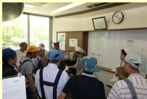
栄養士からの説明