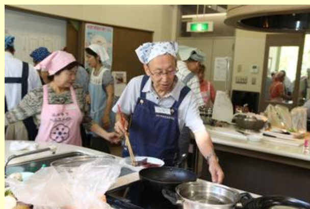
かつおの焼きづけ作り