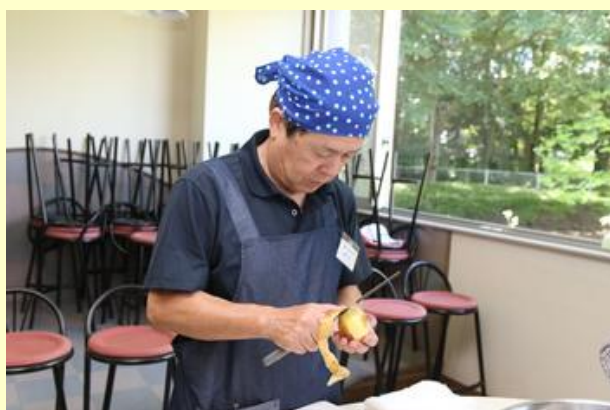
ポテトサラダ作り