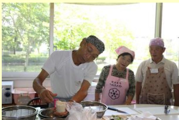
初めにご飯を炊きました

参加者は、食生活改善推進員と栄養士の指導で、野菜の切り方やご飯の炊き方などを学びました。