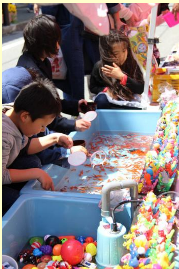
金魚すくいに熱中する子どもたち