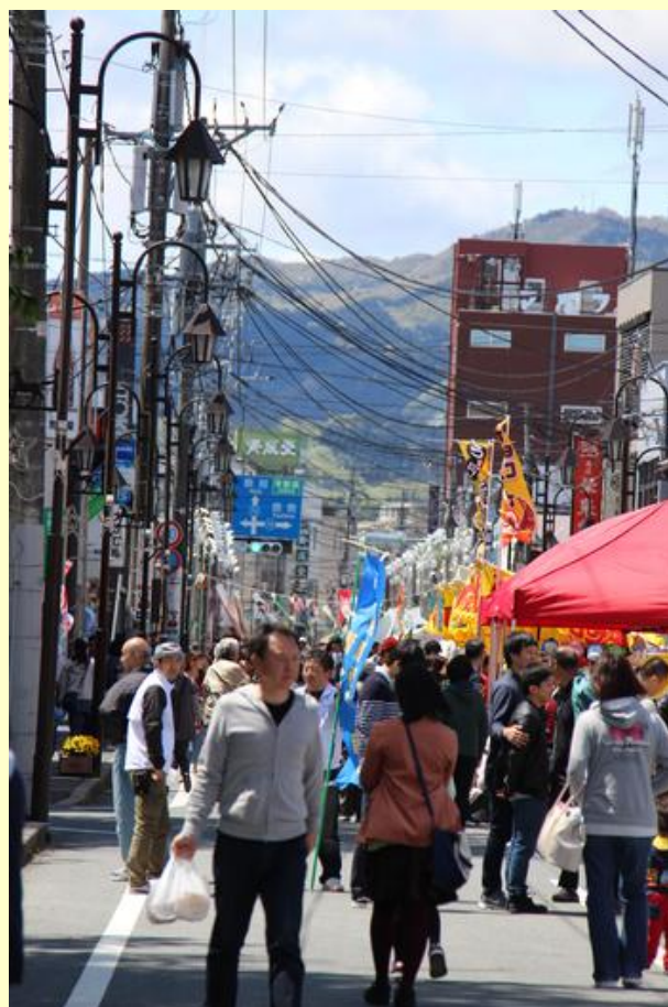
にぎわう歩行者天国