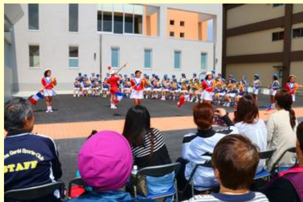
ご家族も子どもたちの演奏に聞き入っていました