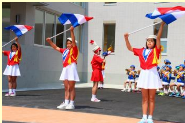
八沢小学校金管クラブによるアトラクション