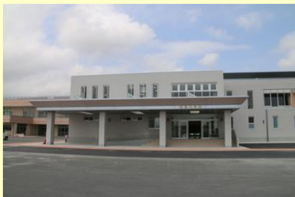
再建された鹿島体育館

鹿島体育館には、子どもたちが屋内で安心して遊ぶための多目的スペースが2階に設置されており、開所初日から早速、子どもたちが思う存分駆け回っていました。また7月2日には、パナソニックパンサーズによる地元の中・高校生のためのバレーボール教室の開催が予定されています。