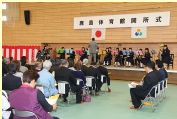
鹿島中学校吹奏楽部による演奏