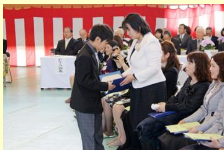
支えてくれた保護者に 卒業証書をお見せします（高平）