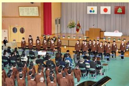
卒業生と在校生で 思い出を語りました（上真野）