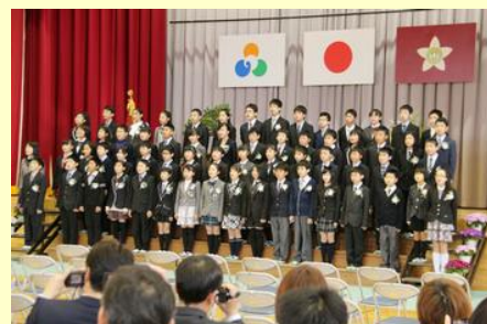
在校生や恩師に別れのあいさつ （原町第一）