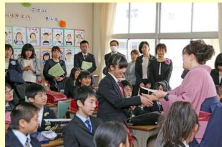
恩師と握手を交わし感謝の気持ちを 示す卒業生（原町第一）