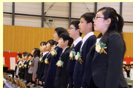
仮設の学びやで最後の国歌斉唱 （福浦・金房・鳩原）