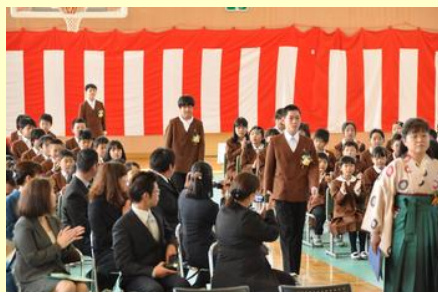
拍手で迎え入れられる卒業生 （上真野）