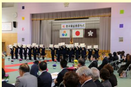
そろって卒業証書を掲げる卒業生 （原町第二）