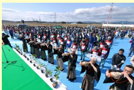
植樹を前に、慰霊の螺に合わせて黙とうをささげました

市主催の植樹祭は今年で3回目です。今回は市内、県内外から約2,000人が参加し、汗を流しました。慰霊の螺に合わせて、海に向かって黙とうをささげた後、震災がれきを利用した50アールの高盛土にアブノキやシラカシ、アカガシなど16種類の広葉樹の苗木約2万本を植えました。