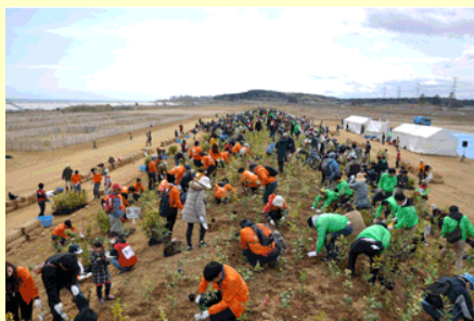
約1時間かけて高盛土が苗木で埋め尽くされました