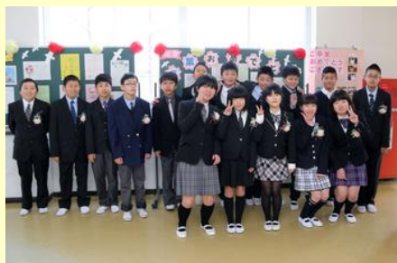
お祝いのメッセージを飾った 掲示板的の前で記念撮影（高平）

このうち、小高区の福浦、金房、鳩原の3小学校では、鹿島中学校の敷地内にある仮設校舎体育館で3校合同の卒業式が行われました。3校の6年生合わせて18人が恩師や保護者らに見守られる中、一人ひとり卒業証書を受け取り、学びやを巣立ちました。