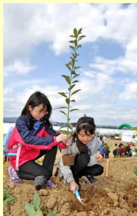
大きく育ちますように