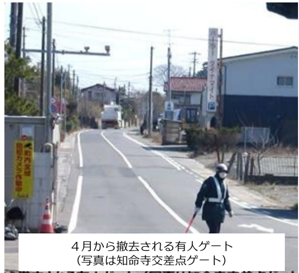
4月から撤去される有人ゲート (写真は知命寺交差点ゲート)