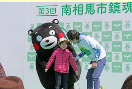
会場に設置されたステージではゲストとの触れ合いが繰り広げられました