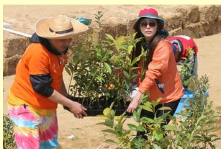
晴天の下、植樹が始まりました