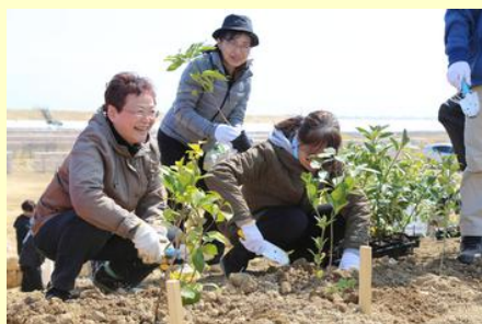
会場では笑顔があふれていました