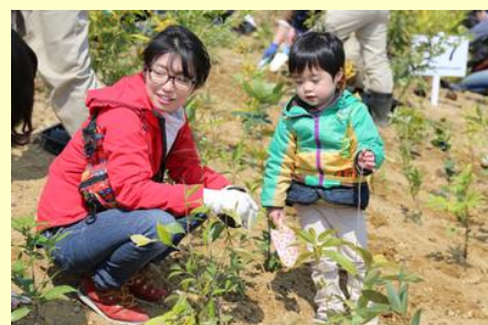
老若男女が思い思いの人と参加していました