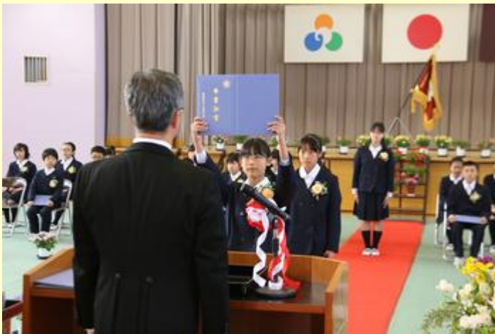
卒業証書を受け大きくお辞儀します（原町第二小学校）

今年度の卒業生計399人は東日本大震災当時、小学1年生でした。6年間で成長した姿を保護者や来賓の方に見せていました。