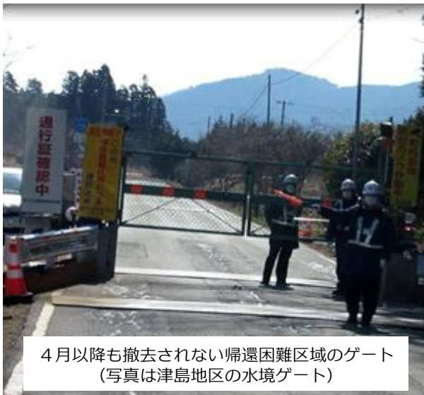
4月以降も撤去されない帰還困難区域のゲート (写真は津島地区の水境ゲート)

なお、帰還困難区域の有人ゲートおよびバリケードは引き続き国の管理下で運用されます。