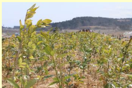
日の光で輝く植えられたばかりの苗木