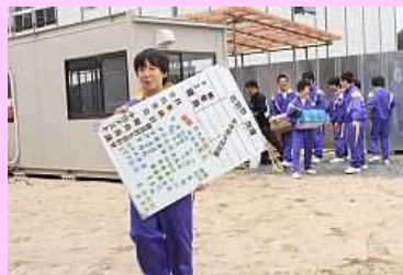
ユニット校舎から運び出す生徒