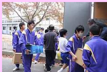
トラックに積み込む生徒