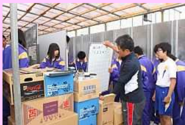
たくさんの引っ越し荷物

9月30日に解除された緊急時避難準備区域にある12校のうち、当面5校が元の校舎で授業を再開します。