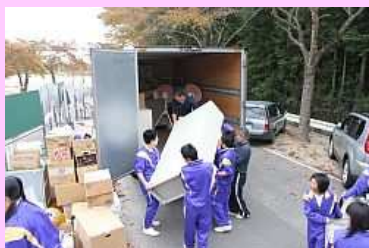
力を合わせて積み込む生徒