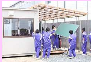
黒板は大きいので大変！