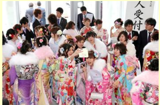
友人との記念撮影(2)