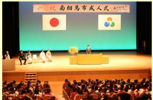
新成人による未来へ向けての意見発表