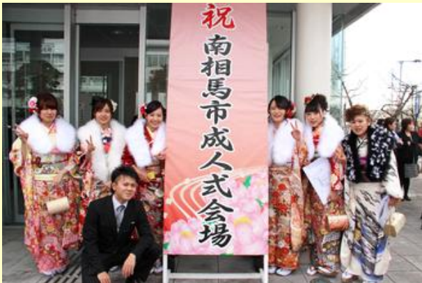
友人との記念撮影(1)

また、小・中学校時代のアルバムや恩師のメッセージなどをつづったスライドショーの上映や、新成人5人による未来へ向けての発表も行われ、会場から拍手や歓声が起こっていました。