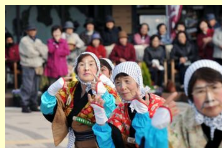
個性的な化粧も楽しい「おいとこ踊り」