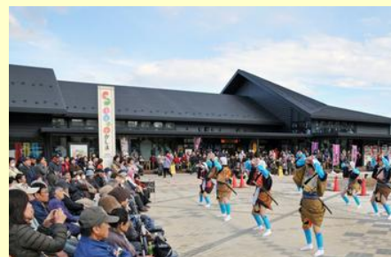
市内の民俗芸能が披露されました

出演団体のうち、馬場民俗芸能保存会は原町区馬場に伝わる神楽の余興の芸の1つ「おいとこ踊り」を踊りました。綿入れを着た踊り手のあいぎょうのある手踊りに、観客は笑顔で拍手を送っていました。