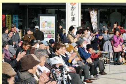
出演者には大きな拍手が送られていました