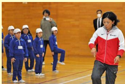
丁寧な指導に児童も興味津々でした