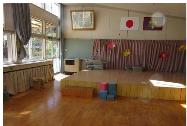
苅野幼稚園のお遊戯室