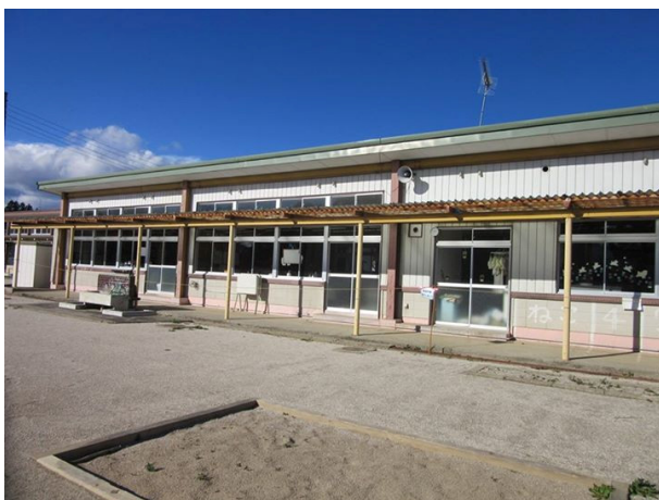
除染が済んだ苅野幼稚園の園庭

苅野幼稚園は、校庭の除染が済んできれいになっていました。園舎となりのお遊戯室は、原発事故発生当時の一次避難所として使われたものです。