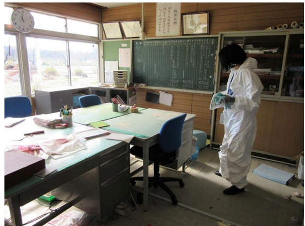
大堀幼稚園の職員室の片付け作業

居住制限区域にある大堀幼稚園では、ドアや窓ガラスが破損しているため、タイベックスーツを着用しての作業です。