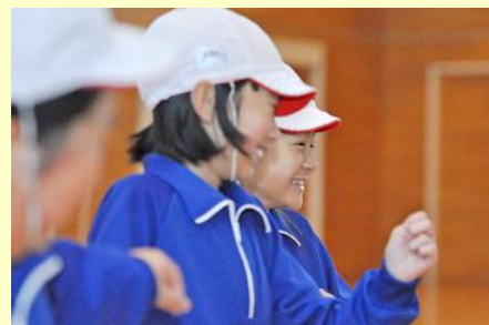
楽しい授業で笑みがこぼれていました