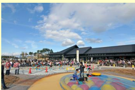
天気にも恵まれ多くの観客が集まっていました