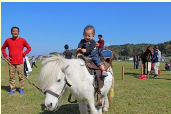
ポニーとのふれあい