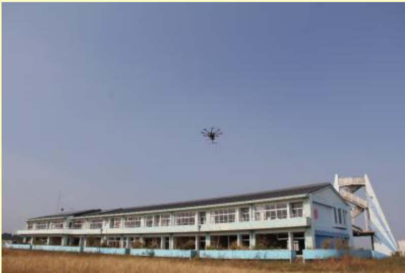
請戸小学校とドローン

また、被災建物の内部も立体データ化して模型や立体映像の制作に利用できるよう、請戸小やマリパークなみえの中でも事前調査が行われました。