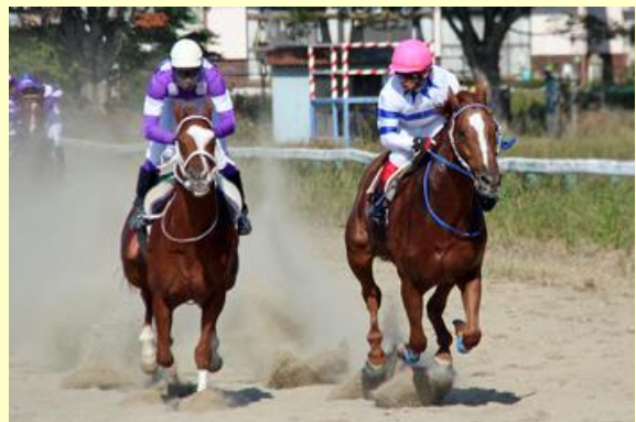
直線で競り合う2頭