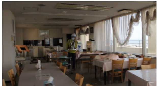
マリンパークなみえ3階の展望レストラン