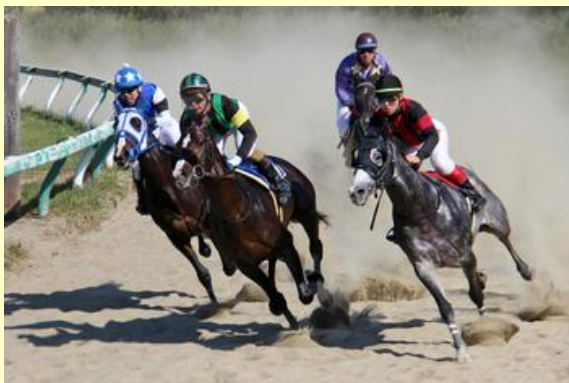
人馬一体の迫力あるレース

また、ポニーとのふれあいや乗馬体験、ちびっこ神旗争奪戦なども行われ、子どもたちは爽やかな秋の一日を楽しく過ごしていました。