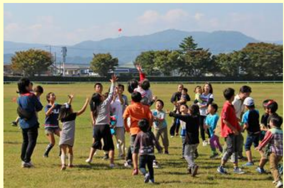
ちびっこ神旗争奪戦