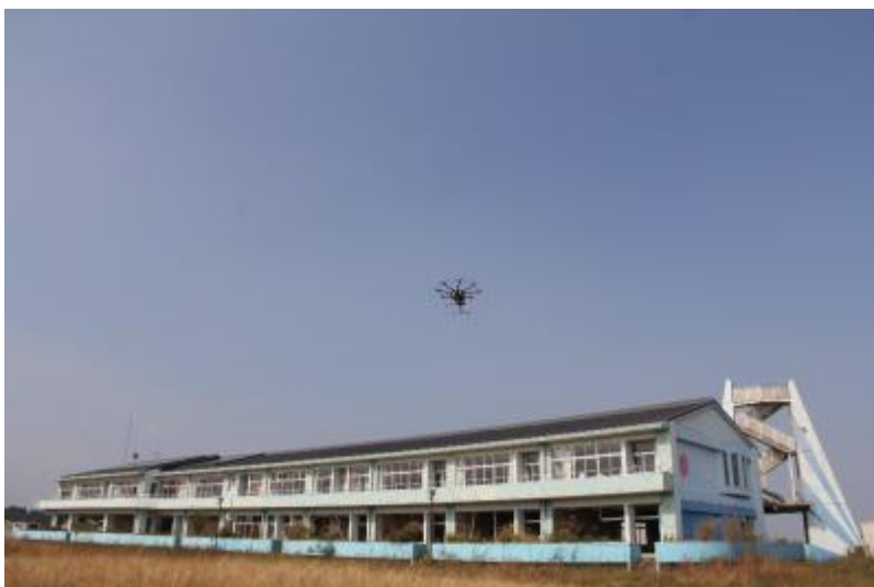
浪江町立請戸小学校