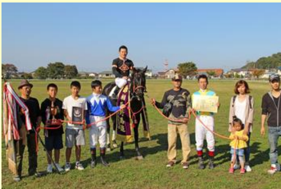
優勝したポラリス号