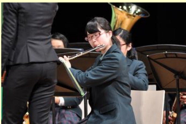
演奏でも出演し聴衆を魅了した斉藤さん