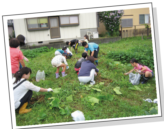
さんじょう開拓村取材