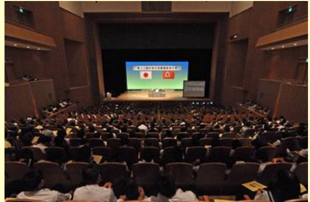
会場には市民など約700人が来場しました