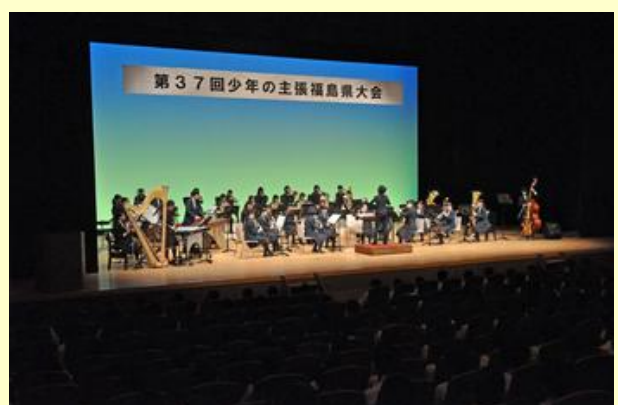
原町第一中学校吹奏楽部が演奏を披露しました