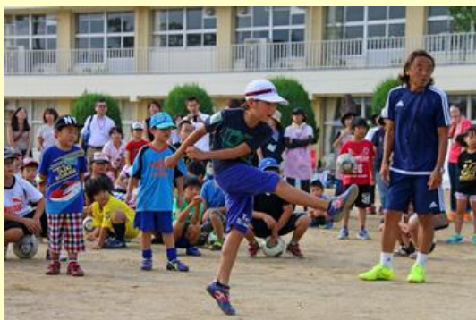
シュートなら任せて！

子どもたちは最初、緊張していたようでしたが、次第に笑顔が増え、憧れの選手たちと一緒にボールを追いかけていました。