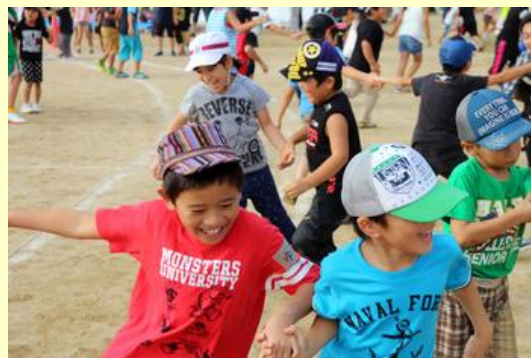
2人一組になって“ボール鬼”