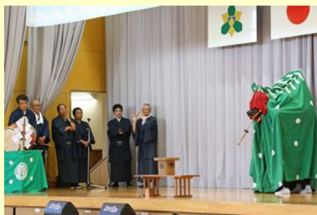
南柚木神楽保存会「太刀飲み接ぎ神楽」