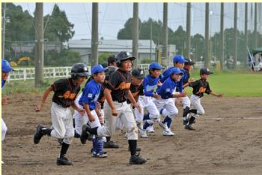
グラウンドへ駆け出す南相馬ジュニアナイン