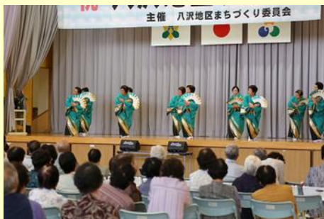
かしまスポーツ民踊クラブ