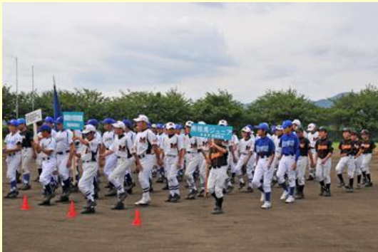
はつらつと入場行進する選手たち

地元の南相馬市少年野球教室、南相馬ジュニアを含めた6チーム約100人が、試合を通じて親睦を深めました。