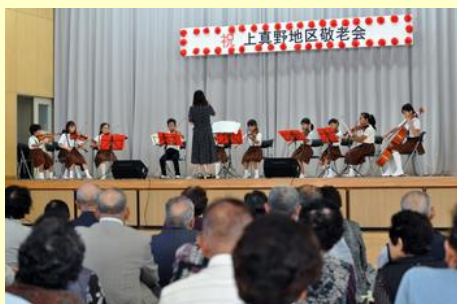
上真野小学校器楽部