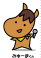
みじゅーまーくん