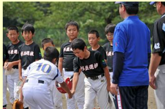
試合前に握手を交わす選手たち