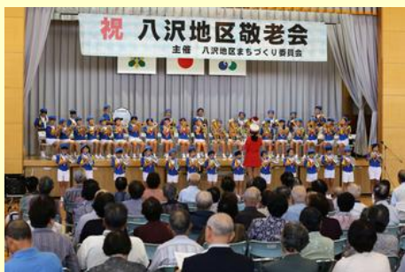
八沢小学校金管クラブ