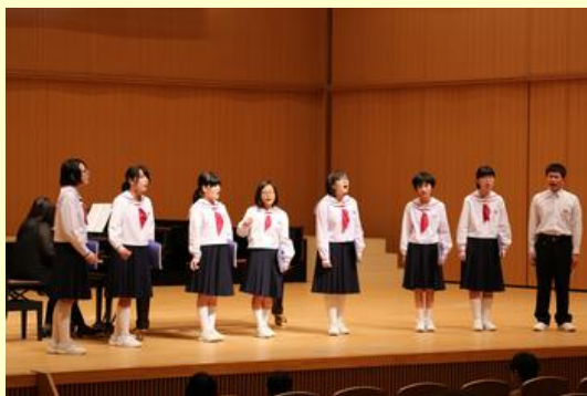
小高中学校合唱部