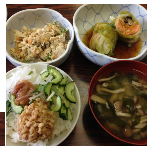
7月の食事会メニュー 「夏バテしらず ランチ&デザート」