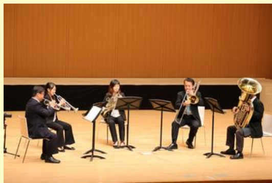
日本フィルハーモニー交響楽団金管五重奏