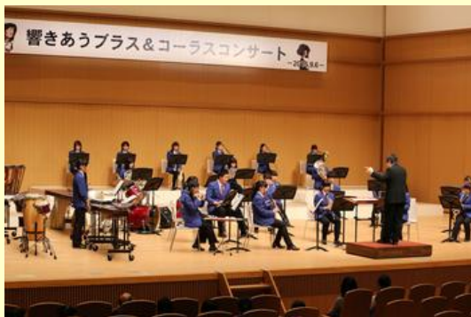
原町高等学校吹奏楽部