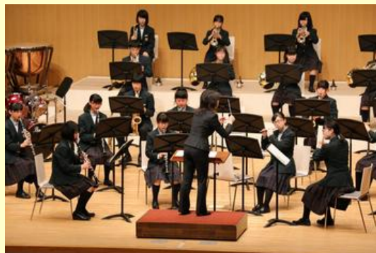
原町第一中学校吹奏楽部