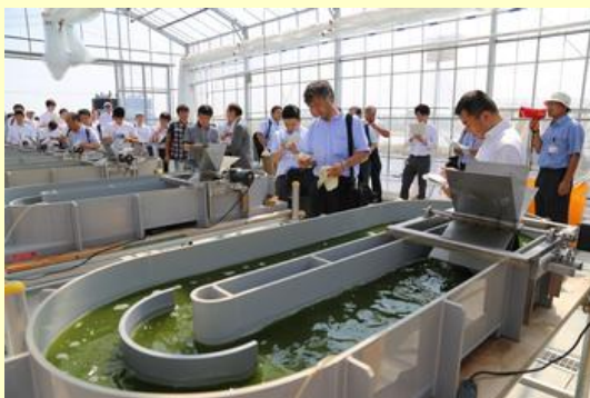
培養方法などを説明

今年中に藻類からオイル等の原料を作る施設が完成する予定で、実証研究の進展によって新規事業の開拓や新たな雇用創出などが期待されています。