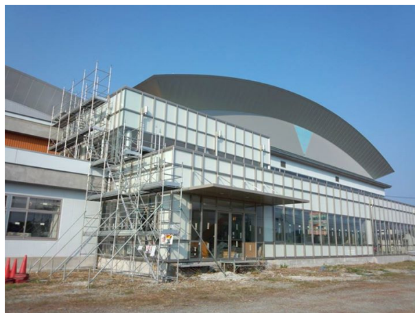
建物外観（除染作業中）