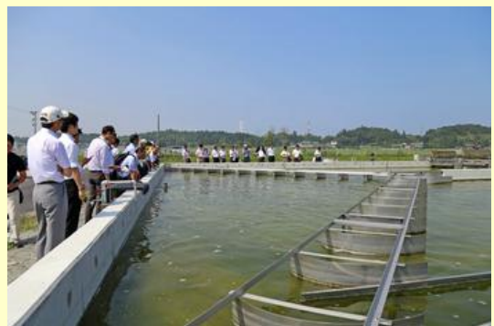
1,000平方メートルの巨大レースウェイで培養