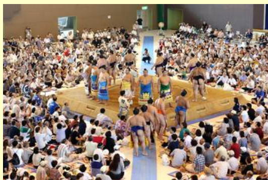
多くの市民らが大相撲を観戦しました