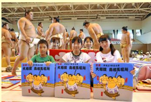
一部の座席の方に記念座布団が贈られました