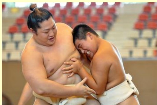
本気で力士と組み合う子どももいました