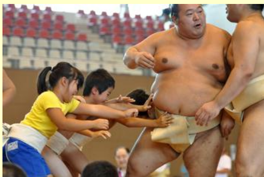
力士とちびっ子力士が触れ合いました