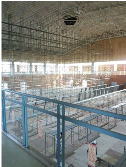
天井部分の点検をするために足場が組まれたメインアリーナ

このスポーツセンターは、帰町が叶った際に町民が集う公共施設として使用できるよう、設備の修復と完成に向けた工事が始まっています。