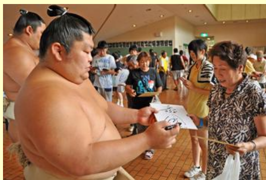
力士はサインや記念撮影に応じていました