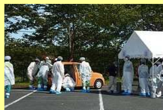
1台ずつスクリーニング