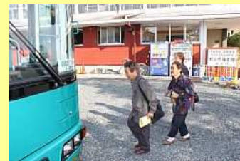
記念品を手にバスに乗り込む