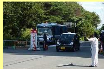
警戒区域から戻るマイカー