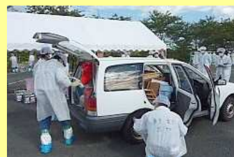
持ち出した荷物のスクリーニング