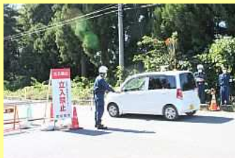
マイカーで警戒区域へ

許可された4時間の中で前回の一時立入りでは持ち出せなかった思い思いの品を車内いっぱい積み込んで戻ってきました。