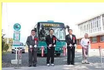
出発を祝ってテープカット