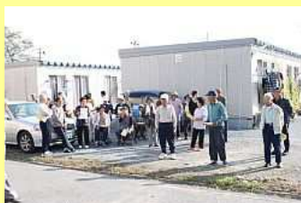
第1号の出発を見送る皆さん