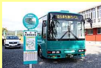
運行される無料巡回バス

バスは乗り降りしやすいノンステップバスで、角川原応急仮設住宅と千倉 応急仮設住宅を発着する2コースがあり、月・水・金曜日に1日5便運行します。