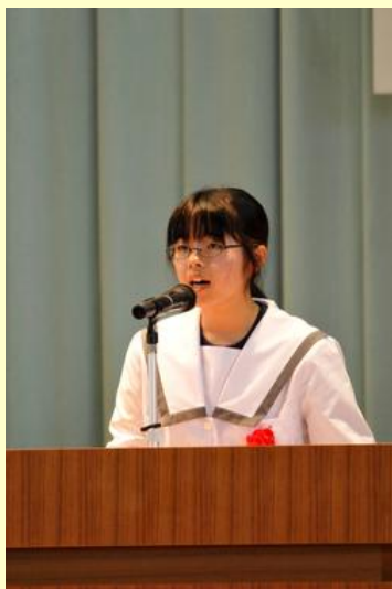
夢や目標を発表しました