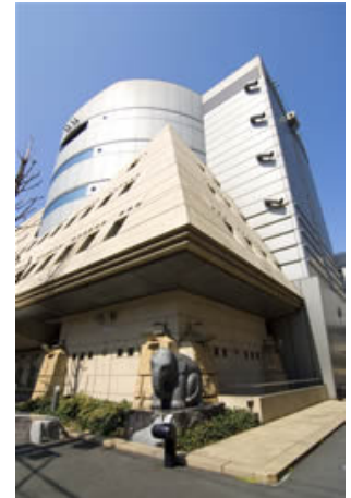
東京消防庁 本所都民防災教育センター (本所防災館)

日時 9月12日 (土) 午前6時 総合福祉センター集合 午後11時 // 解散