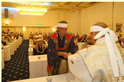
役付辞令・肩証交付（軍師）