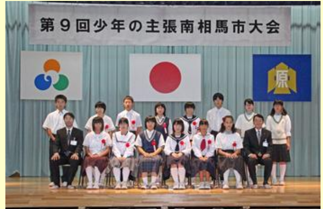
発表した生徒と教育長ら

最優秀賞と優秀賞を決定し、最優秀賞に選ばれた4人は9月25日に市民文化会館「ゆめはっと」で開催される県大会へ推薦されます。