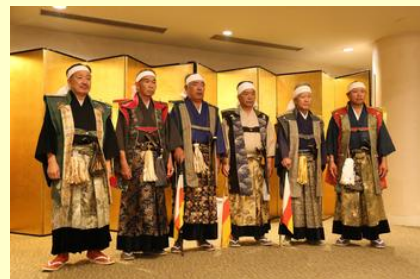
役付ごとに写真撮影（副軍師）