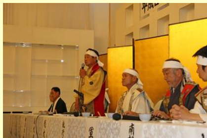
訓示を述べる副大将