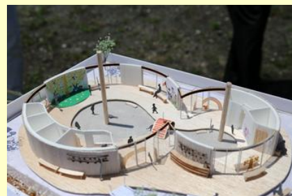
「砂場」がテーマとなっている