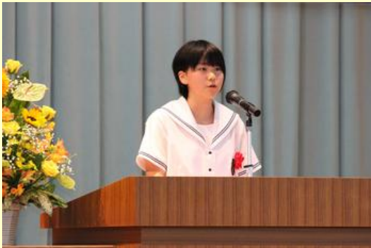
生き生きと弁論していました