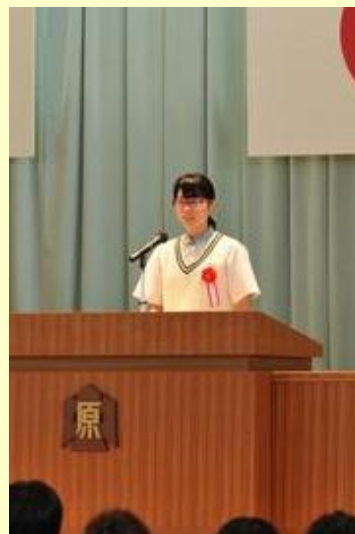
大きな拍手を受けていました