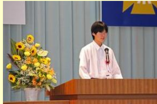
地元の復興について語るりりしい姿