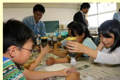
水がきれいになったよ！