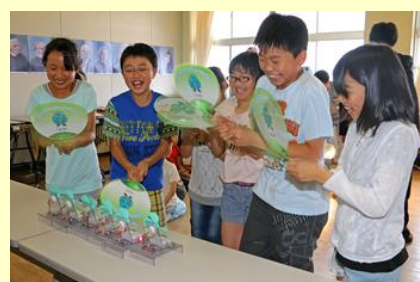
うまくランプがつかかな？

子どもたちは、講師の東北電力社員から、どんな種類の再生可能エネルギーがあるのか、なぜ再生可能エネルギーが必要とされるのかなどを学びました。太陽光発電や風力発電の模型を使って、発電する仕組みを実際に体験しました。