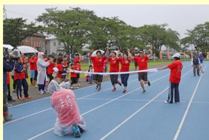
最後はチーム全員でゴール