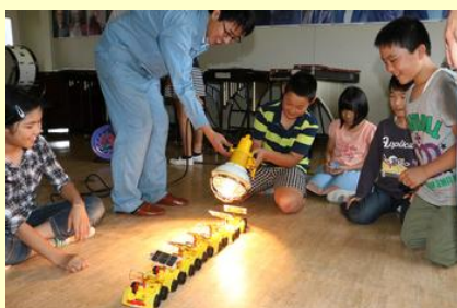
ソーラーカーを繋げて