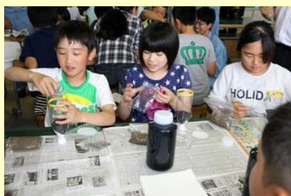
ペットボトルでろ過装置を作ります