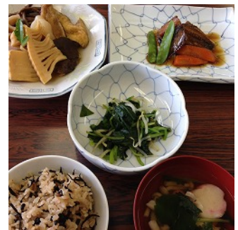
5月の食事会メニュー 「三条祭りのごちそう」

申込締切 7月4日(土)正午 交流ルーム「ひばり」 TEL 0256-33-8650