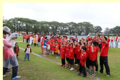
チームごとに応援メッセージを撮影