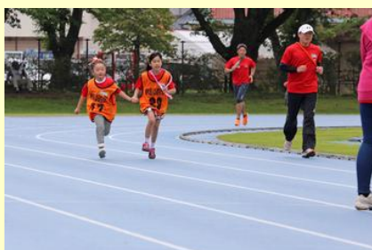
手をつなぎ仲良く走る姿も