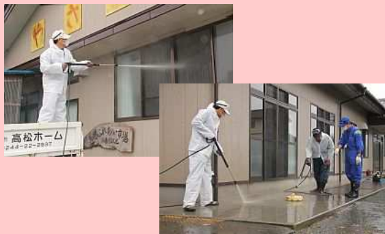
■9月11日 原町区馬場地区