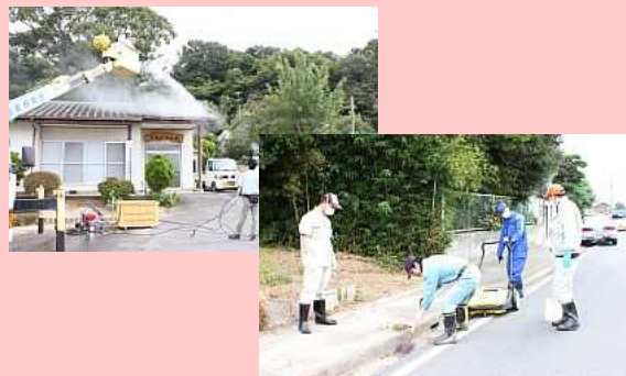
■9月17日 鹿島区南屋形地区