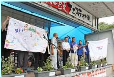
千羽鶴やメッセージをいただきました

9月11日、南相馬市復興イベント「和太鼓フェスティバル〜心をひとつに、力を併せて一歩前へ〜」は、原町区の旭公園で開かれ、力強い和太鼓の演奏が披露されました。フェスティバルには、相馬野馬追太鼓をはじめ、奥州相馬馬りょう太鼓協会、大阪府のいずみ太鼓、浅香泰子集団「獅子」、福島市の愛宕太鼓連響風組が出演し、繰り広げられる勇壮な演奏が市民の元気と勇気を奮い立たせ、観衆の心を響かせました。