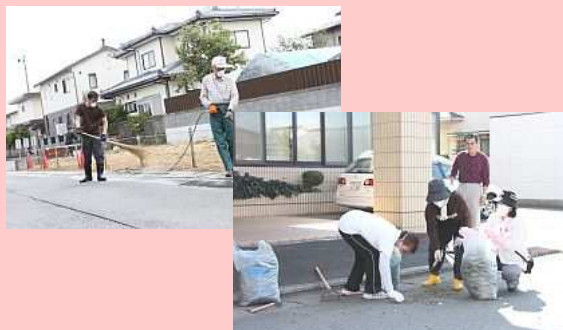
■9月17日 原町区北町2地区