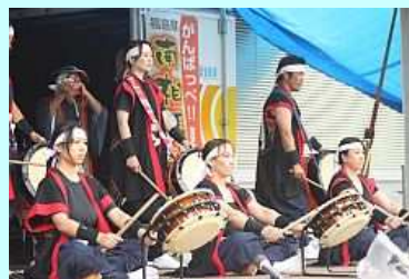
オープニングを飾る「相馬野馬追太鼓」