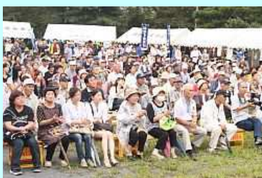
拍手を送る皆さん