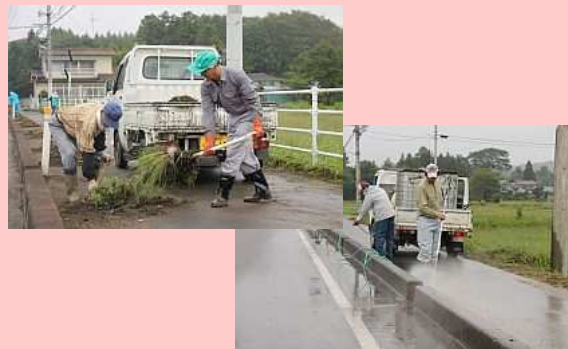
■9月11日 原町区深野地区