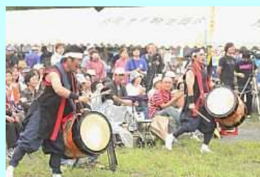
ステージを飛び出して！