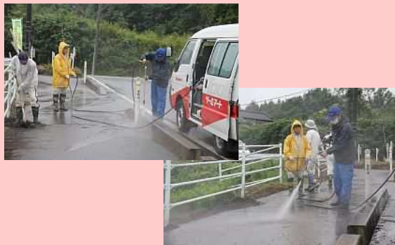
■9月11日 原町区益田地区