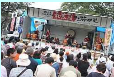
会場に響く太鼓の音