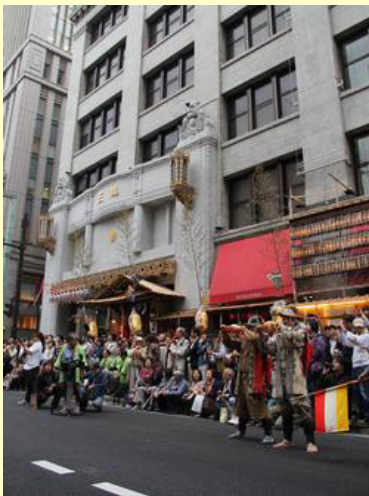
人であふれた沿道