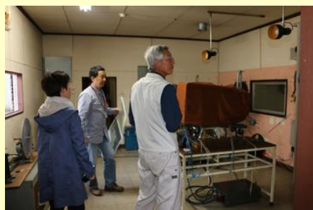
映写機が残る映写室 (朝日座)