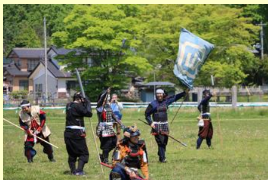
敵陣営の旗を取れば勝ち