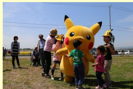
ポケモンのキャラクターも登場