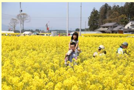
上から眺めてゴールを探せ

子どもたちが迷路の外で待つ親に助けを求める場面もあり、参加者からは、「結構難しかった」などの声が聞かれました。