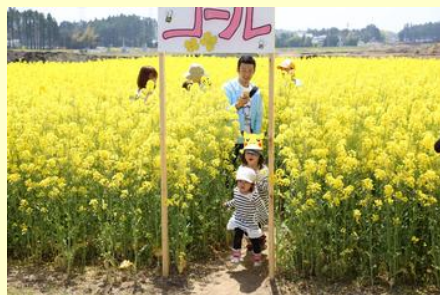
勢いよくゴールする子どもたち