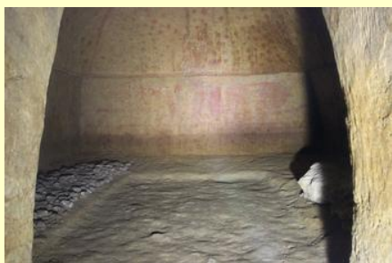
壁画の見える横穴内部 (羽山横穴)