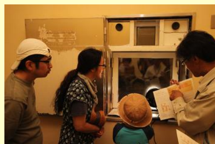
ガラス越しに横穴の内部を見学 (羽山横穴)

羽山横穴の一般公開は4、5、9、10月の第2日曜日で、今回は9月13日の予定です。