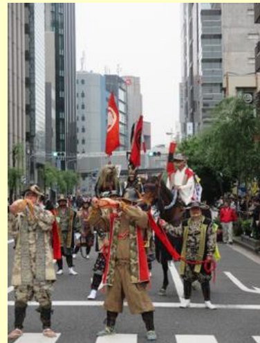
陣螺（じんがい）術の披露