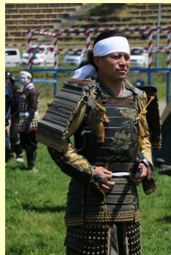
相馬野馬追の伝統ならではの凛々しい武者ぶりです