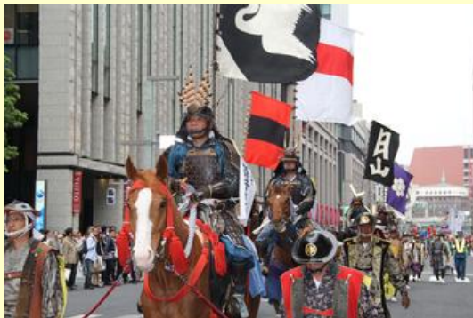
甲冑騎馬武者は9騎