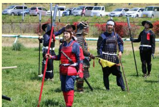
女性も参加しています