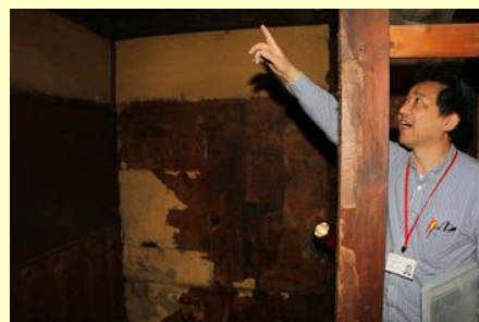
市職員が施設の構造や歴史を解説 (朝日座)