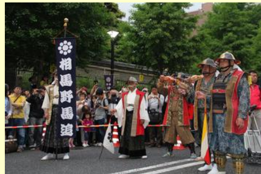
神田明神鳥居前での着陣式