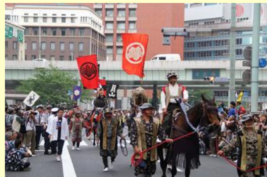
桜井市長（手前馬上）が執行委員長