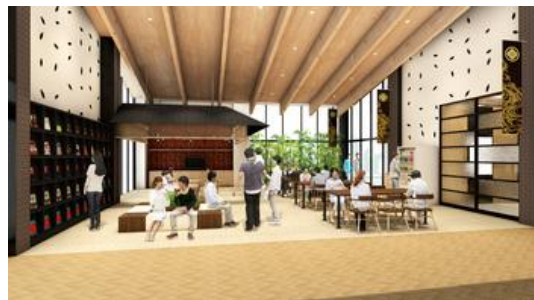
コミュニティ広場