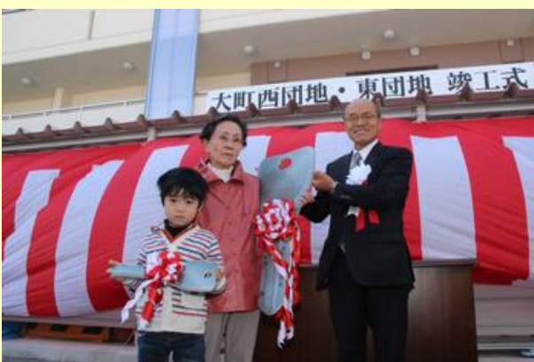
入居者代表への鍵引渡し