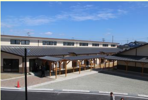
高齢者用の低層棟住宅

高層棟住宅は、各階へのエレベーターを備え、屋上には太陽光パネルを設置した先進的機能を持ち、また、低層棟住宅は、木造によるやすらぎと温かみがあり、吹き抜けによる開放感と高齢者の皆さんが安心して暮らせるバリアフリーに配慮しているところが特徴です。