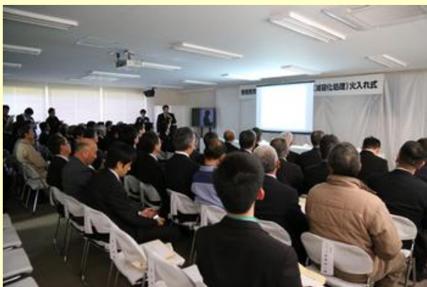
事業者による施設の説明

桜井市長は、施設建設に協力いただいた地元行政区に感謝するとともに、「事故が無いよう焼却処理が進捗することを望みます」とあいさつしました。