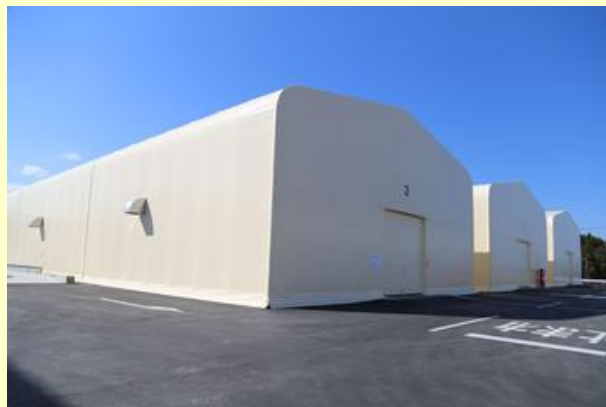
焼却後の灰を保管する施設