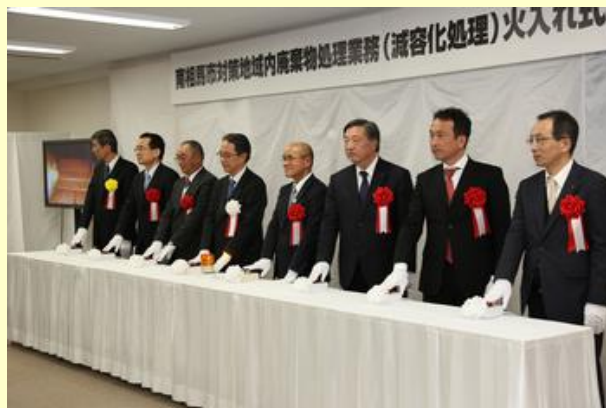
点火スイッチを押す市長ら